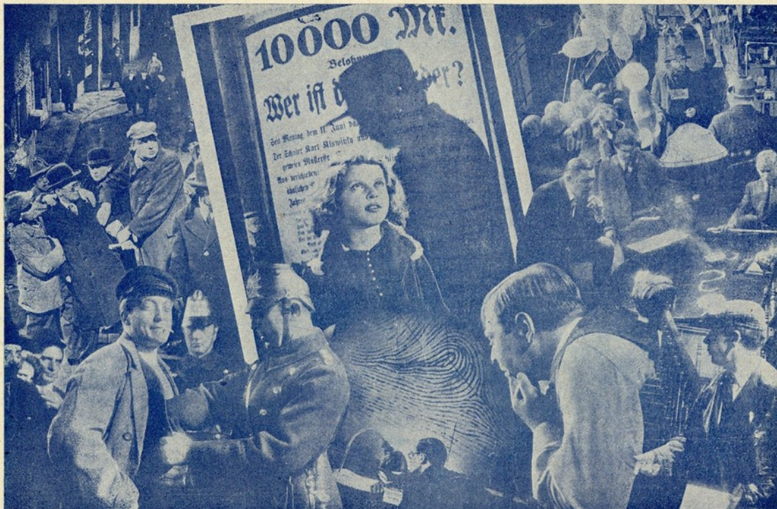
Imagens do surpreendente fonofilm «Matou»