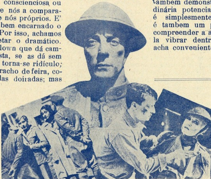
Imagens do fonofilme «Em frente, marche!»

Correm boatos a respeito de Henry Garat.