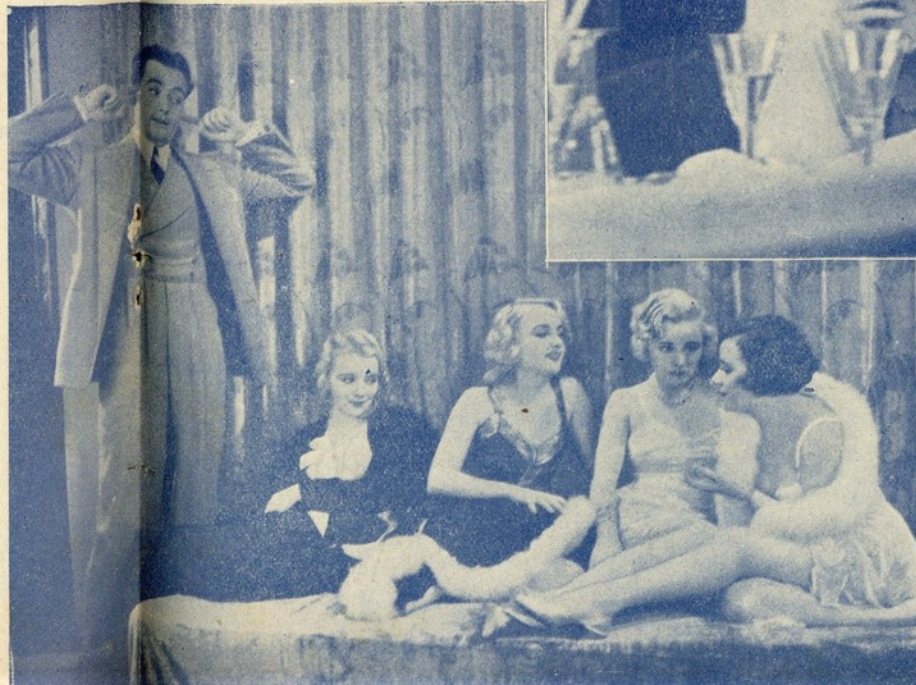
De cima para baixo: Yola d'Avril, Fifi d'Orsay e Sandra Ravel no filme «Aquelas três francesinhas» — Lilian Harvey, Willy Fritsch e Gustav Frohlich, artistas da Ufa, no baile dos colaboradores da indústria cinematográfica de Berlim — Uma cena do filme «Safety in numbers».