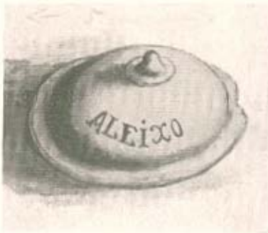
Tegela de caldo, Saleiro e Tampa de Tegela. (Des. de C. M.)