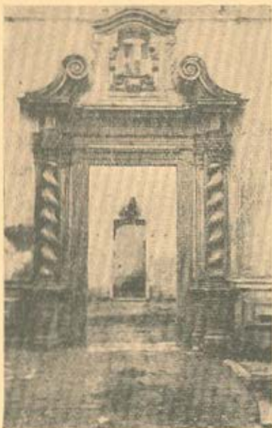
PORTA SEISCENTISTA no átrio superior do palácio dos Mendoças Furtados (Calçada do Cardial, a Santa Clara)