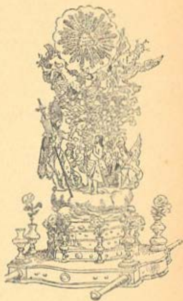
O BAPTISMO DE CRISTO

ANDORES ANTIGOS, DE PRATA que figuravam na procissão do Sacramento em Beja