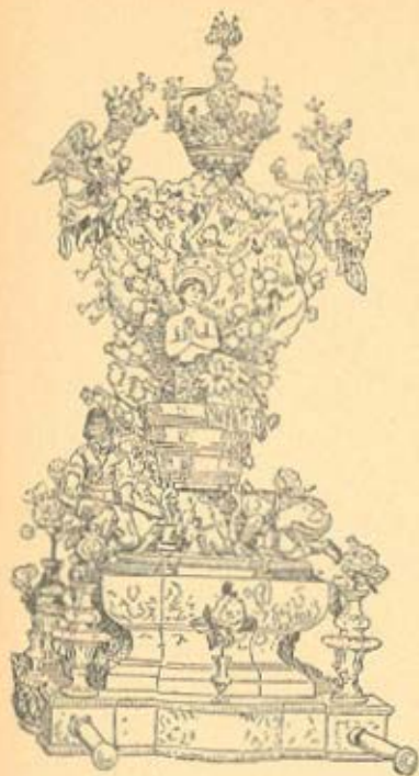
S. JOÃO EVANGELISTA