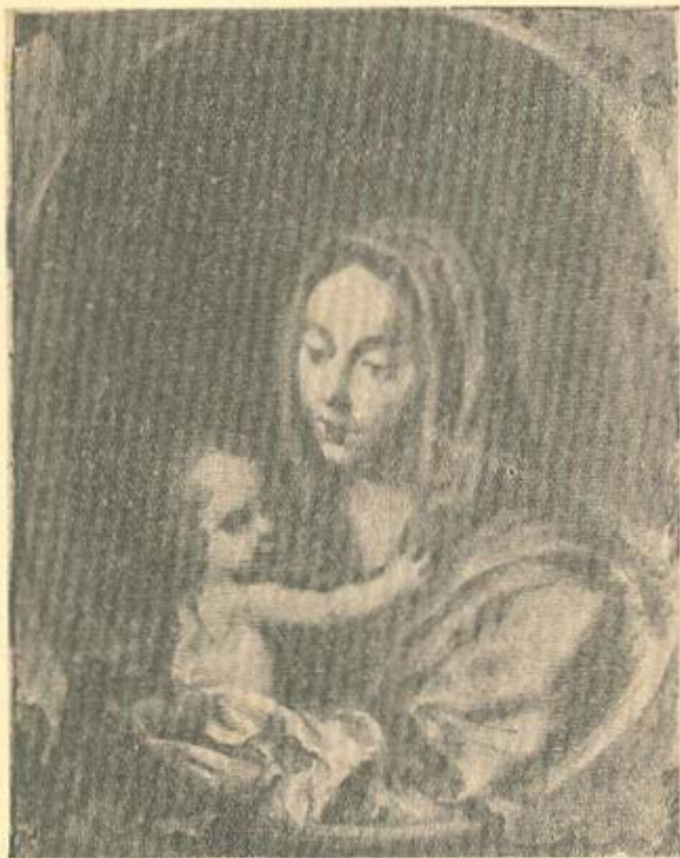
A VIRGEM E O MENINO JESUS Quadro de J. P. Binhetti