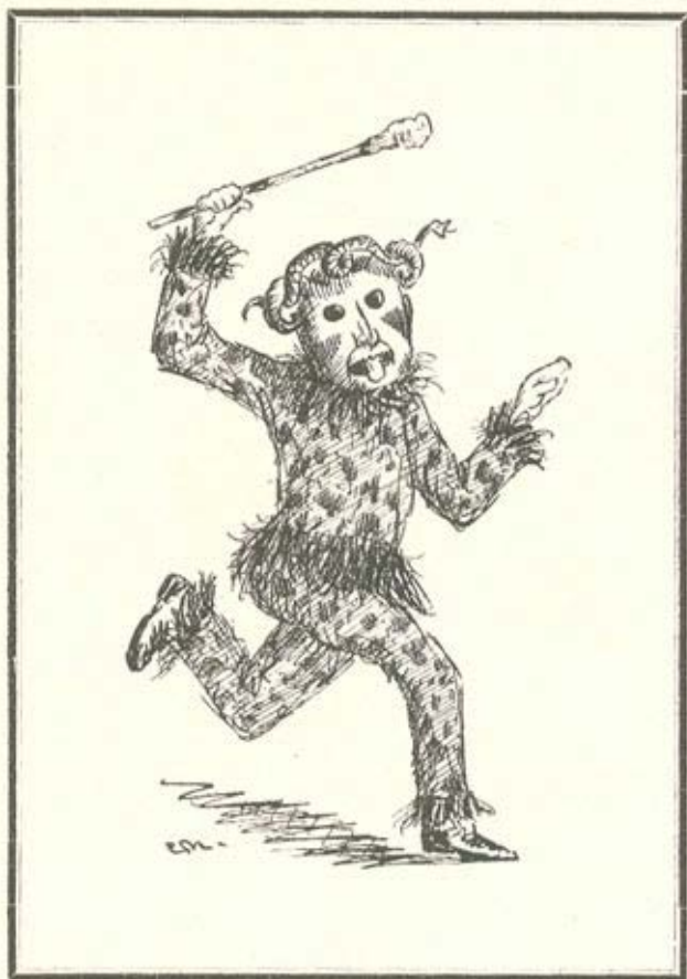
O CARÊTO DE VALVERDE (Des. de C. M.)