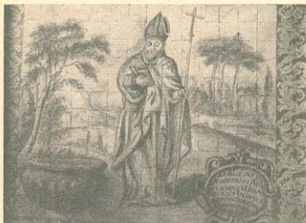
D. AFONSO NOGUEIRA, ARCEBISPO DE LISBOA Azulejos monóchromos de "Os Lóios" de Arraiolos.