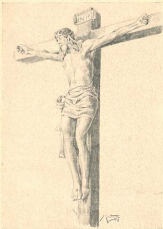
O «CRISTO DOS OLIVAIS»