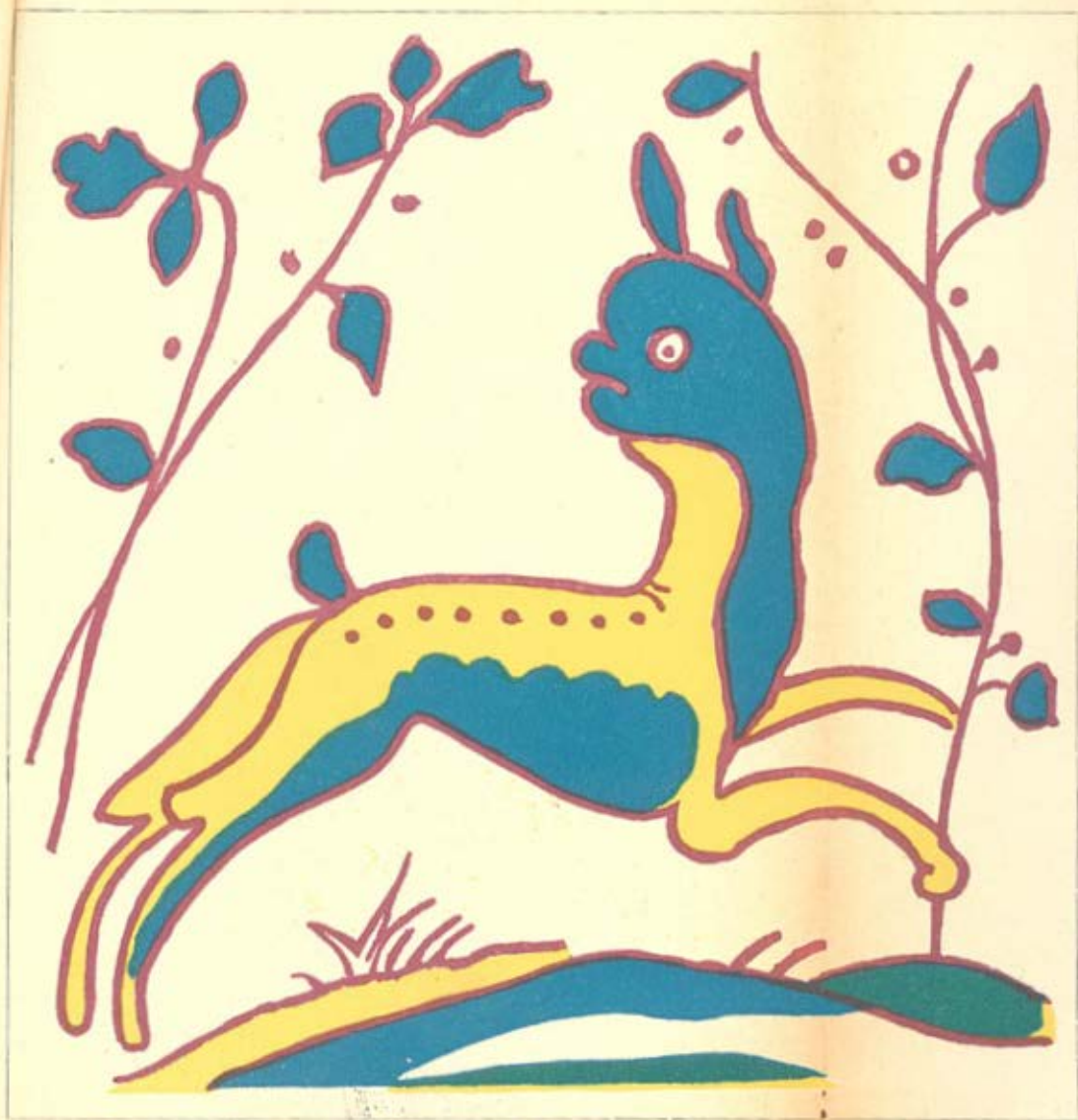
ASULEJO DE FIGURA AVULSA