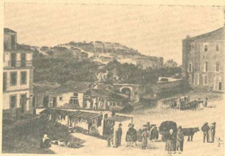
A Feira da Ladra na Praça da Alegria de Cima, nos princípios do século XIX. Fotografia de uma aguarela de autor desconhecido, adquirida pelo Visconde de Castilho