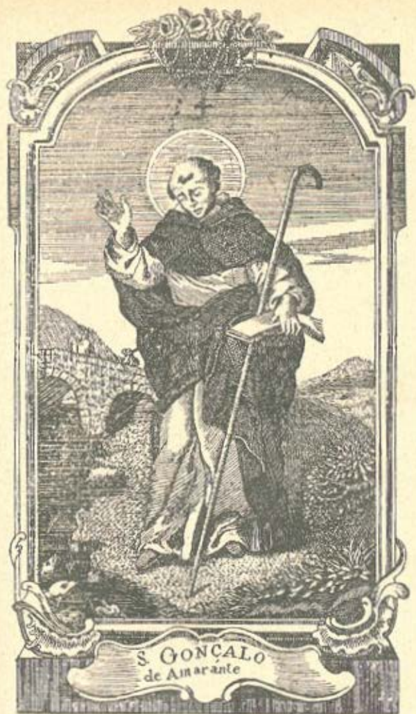
Grav. de Manuel da Silva Godinho (Sem a capela do Santo)