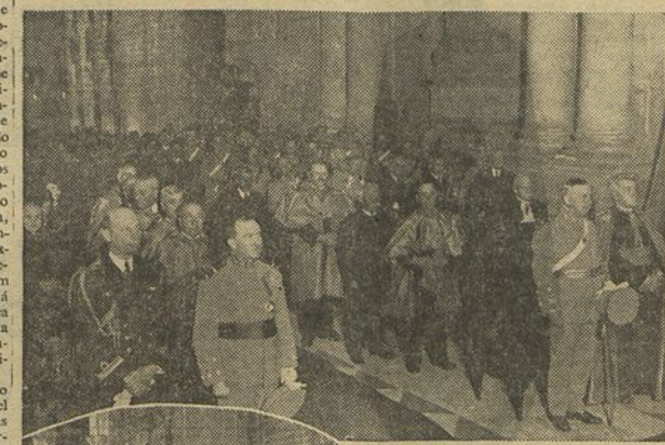
Dois aspectos da cerimonia religiosa que hoje se celebrou nos Jeronimos, com a assistencia do sr. ministro da Guerra