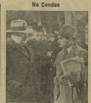
Edward G. Robinson, o popular actor norte-americano que já vimos interpretar o papel dum pescador português de New Bedford, e que é o protagonista de «O Pequeno Gigante», o filme que esta noite se estreia no Condes