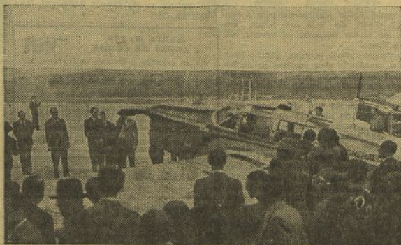
O voo Sevilha-Mexico — A largada do «Santander», do aerodromo de Sevilha (Lêr noticia na 8.ª pagina)