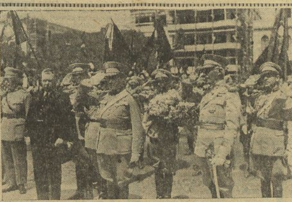
O sr. ministro da Guerra e as entidades oficiais em continencia perante o monumento da Avenida