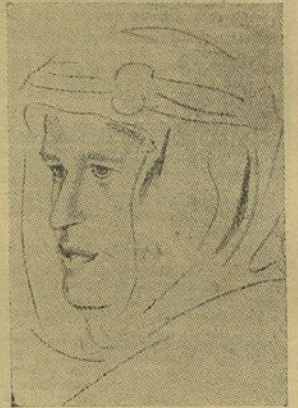
T. E. LAWRENCE visto por A. John

Um dos seus biógrafos acentua que foram dois anos de epopéia cheios de raíds, de guerrilhas, de privações, de soffrimentos, de intrigas, anos durante os quais Lawrence demonstrou um talento unico feito de audacia,