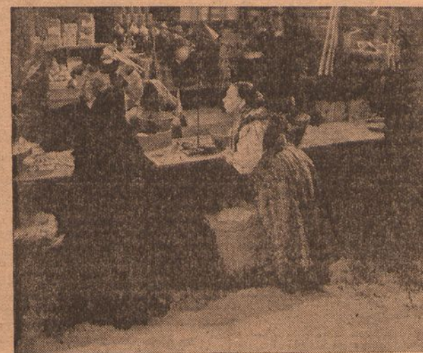
A má lingua, os «ditos», as intrigas—assunto que Julio Diniz tão pitorescamente desenvolveu no lináissimo romance, que Leitão de Barros adaptou ao cinema com extraordinário êxito—não é um produto apenas das terras pequenas e dos meios estreitos. Nas capitais, também ha aldeias... e criticos