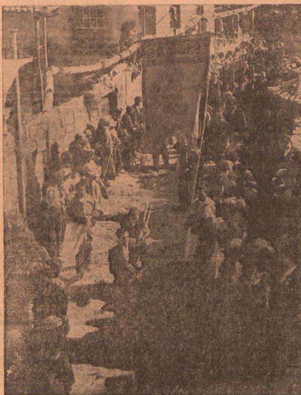
Sem desprimor para os criticos que se referiram ao caso, publicamos, aqui, esta fotografia inédita. Tem o interesse de nos mostrar o celebre foguete, considerado como um dos graves defeitos das Pupilas, pelo simples facto de não se lhe ouvir o estouro...