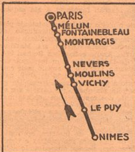
Itinerario da «étape» Nimes-Paris

Os automobilistas que concorrem ao «Rallye» Internacional de Marrocos partiram esta madrugada de Nimes, a caminho de Paris, onde devem chegar, dentro da média exigida, ás 19 e 17.