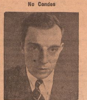
Buster Keaton, o popularissimo Pamplinas, numa das mais engraçadas situações da super-comedia O Rei dos Campos Eliseos, o exito da actualidade no Condes

interpretada por Adalgina Abran-ches e pelo maior conjunto dos ultimos annos, em palcos portugueses