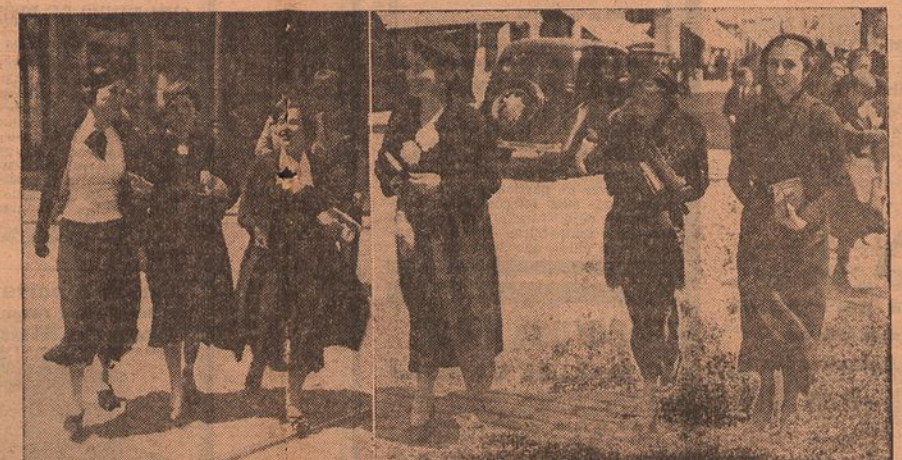
Aspectos da rua: um frizo de lindas raparigas na visita aos templos

Pela primeira vez na tela: O VATICANO, em todo o seu esplendor