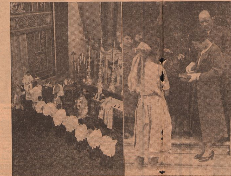
Um aspecto das cerimoniaes de hoje na igreja de S. Domingos e um trecho da venda de rosmarinho á porta dos templos

As montras—elas proprias—vestem-se nas paredes interiores de cor