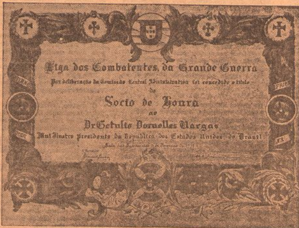
O diploma de socio de honra da Liga dos Combatentes que vai ser entregue ao dr. Getulio Vargas, presidente da Republica do Brasil