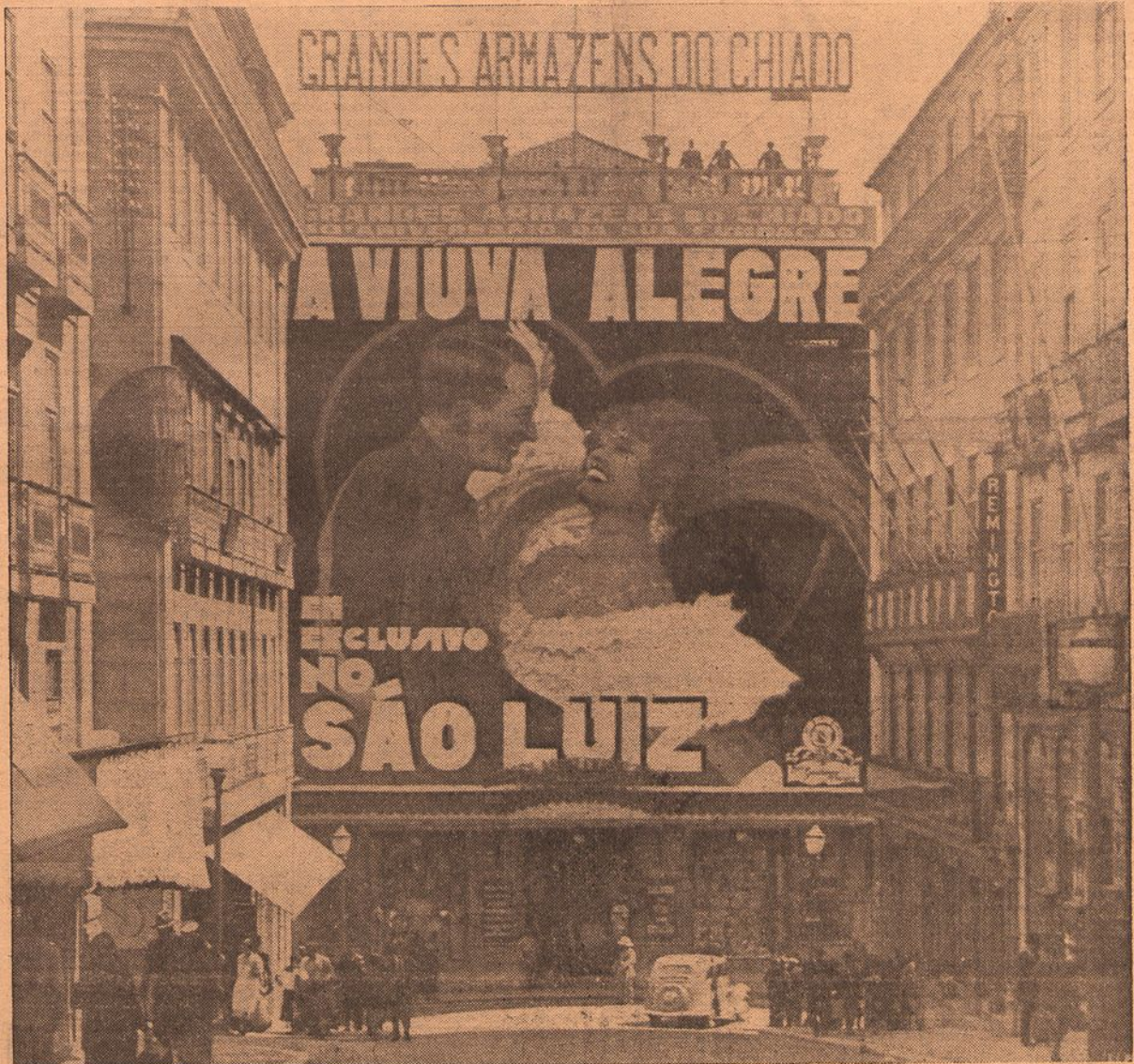
O grande cartaz do filme «A Viuva Alegre», que hoje foi afixado na fachada dos Armazens do Chiado

As cidades, como as mulheres, têm também os seus vestidos: são os cartazes, trama policroma e sugestiva, que as revestem de beleza, de cor, de audácia, num fremito excitante e voluptuoso, que desperta a retina para as grandes viagens da publicidade. O S. Luiz, que já nos tinha dado um belo exemplo de reclamo artístico, com o cartaz de «Vila Villa!» na frontaria dos Arma-