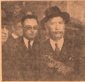
D. Alexandre Lerroux durante as diligências que realizou para formar governo

MADRID, 3.—O chefe do Partido Radical, sr. Alexandre Lerroux, que ontem foi novamente incumbido pelo presidente da República de formar governo, em virtude do chefe do Partido Agrário, sr. Martínez de Velasco, ter declinado o encargo de que fora incumbido,