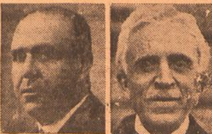
Juan José Rocha e Portela Valladares

devido a forte oposição que encontrou por parte do chefe da Ceda, Gil Robles, que a todo o transe exige que o seu partido tenha a maioria no novo gabinete, passou toda a manhã na sua residência, recebendo a visita de algumas personalidades do Partido Radical, com as quais trocou impressões