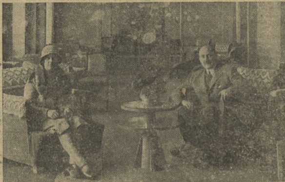
O principe Artur de Connaught e sua esposa, que ha dias se encontram hospedaos no Palacio do Estoril, e que regressam amanhã a Inglaterra