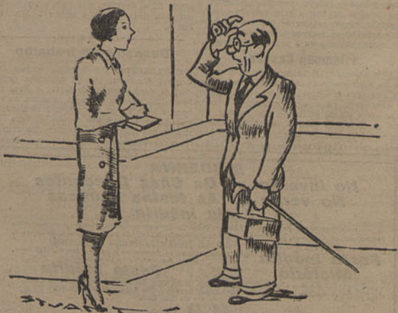
— Quería comprar um chapéu. — Chapéus é no 1.º andar, secção de antiguidades.

Quando as condições sociais toleram a injustiça, urge suprimir ou pelo menos atenuar esta, a fim de que o poder judicial não gire dentro dum circulo vicioso.