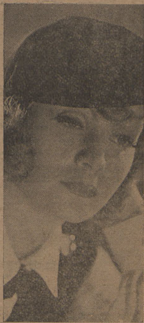
Greta Garbo, afastada ha um ano do cinema, regressa a Hollywood, onde será dirigida por Mamoulian, o realizador do Medico e o Monstro .

Um dos segredos do seu triunfo — é, sem duvida, a propaganda. Discursos, artigos, festas, bandeiras, cartazes, simbolos, hinos, paradas — e agora o cinema. S. A. Mann Brand éis como se chama o primeiro filme 100 0/0 nacional socialista. Pelo que lemos, trata-se duma obra vigorosa, de nitido caracter politico, no qual se faz a historial romantizada, daquele movimento, desde o seu inicio, com persegui-