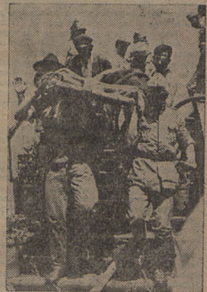
Soldados e populares empregam-se no transporte dos cadaveres carbonizados