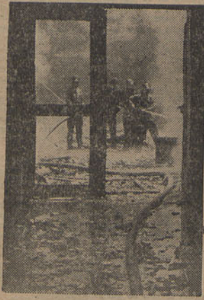
Uma fase da extinção do incendio dentro da officina