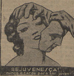
REJUVENEÇA! nunca é tarde para ser joven

Logo apoz a primeira applicação, Terradi torna a pele macia e fina imprimindo-lhe uma frescura sem equal e uma coloração atracente que é o atributo da juventude.