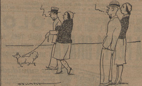
— Aquele já se atirou uma vez ao mar para salvar a sogra. — Não admira... ás vezes, nos momentos de perigo, perdemos o juizo.

B ELOS e patrióticos ensinamentos constituem os actos solenes como o da recente entrega das insignias da Grã-Cruz de Santiago á Academia das Ciencias, cuja iniciativa da Revista Militar representa — como muito bem disse o sr. dr. Julio Dantas, presidente da Academia — “o primeiro grande acto de solidariedade da familia intelectual portuguesa.”