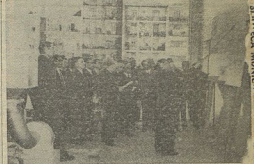
As entidades oficiais, durante a visita à Central Lactaria de Lisboa