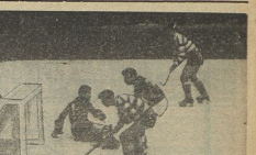
Hoquei em patins... a partida realizou-se com grande interesse...