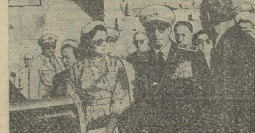
O Xa de Péria e o Imperatriz Sarna fotografadas durante o seu recente regresso da Itália, em Roma, quando da sua chegada oficial à Turquia