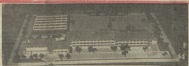
Maqueta da nova Escola Técnica (em construção) de Braga, cujos obras são amanhã visitadas pelo sr. Presidente da Republica

O sr. Presidente da Republica agradeceu as acções do multido, ao assistir, antes, ao inicio da canção de Inozze, na Pariz