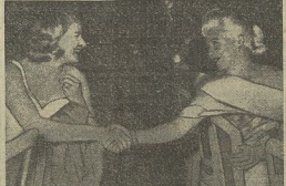
A simpática redeta americana Gagar-Rogers apresentou o Festival de Cannes para fazer os portugueses conhecerem o que os outros de músicos cantadas. Aqui a vemos recordando as farsas de Fernando e acompanhando (um pouco ainda) frouxamente. — Ingrid Bergman

PARIS, 27 — Perante uma esmagadora enernia, no Estádio Colombes, desta cidade, o campeão do «Sedan» bateu o «Troyes» por 5-1, e conquistou a «Taça de França». Os jogadores já saíram por 5-0. — (A.N.)