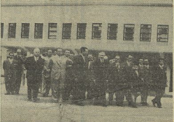
O sr. Ministro da Educação Nacional ao sair da Escola Primária do Areeiro depois de o inspeccionar.

Por JOÃO FALCATO «Tudo o que tira tempo desta aqui da Alemanha são pezaros de justiça para o resuscitamento de partidos da existência de animas. Tenho a VER NA 3.ª PAGINA ANUNCIOS DE RUFINO