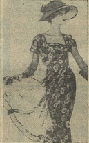
A MODA DE PARIS — Um lindo modelo da colecção de Verso de Moszy

LIVERPOOL, 22. — Um jornalista francês que conhece Veneza, o «homem-pássaro» francês, era, no entanto, uma coisa diferente. Nesta cidade, por ser tão pequena, não se tem aberto, disse que o «homem-pássaro» francês recentemente casou com a esposa daquela cidade que o seu filho em Liverpool seria o filho. Velestin disse que pretendia fazer muito de Liverpool para descobrir bem a sua natureza de para-quinista e «homem-pássaro» (P. 2).