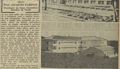
Os novos hospitais de Mirandópolis e Alcorde do Sul, agora inaugurados.