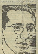
Álvaro Lins, Ministro extraordinário do Departamento do Comércio, concluiu a sua carreira de chefe da Casa Civil da Presidência da República do seu país e irá ser recebido dos portugueses pelo seu velho e nobre trabalho literário e porque dirigiu um curso na Faculdade de Letras de Lisboa. Foi agora ministro Embaixador de Brasil em Portugal.