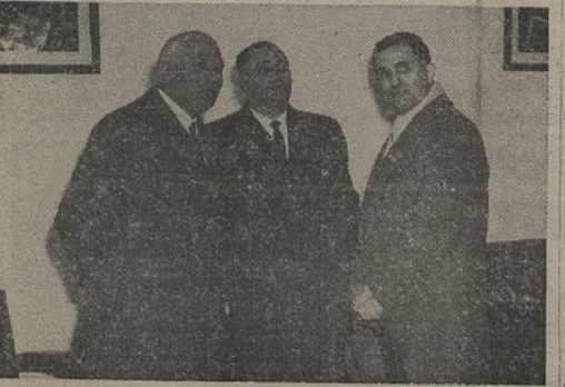
Muito antes de tomar lugar no avião, o Ministro da Instrução Publica de Itália, conversando com os Ministros dos Negócios Estrangeiros e da Educação Nacional

Os arrojados ensaios que estão a ser feitos na América PARA A CONQUISTA DO ESPAÇO a velocidades em que o calor desenvolvido pelo ar é do ar FUNDE OS METAIS MAIS RESISTENTES