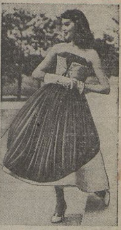
Curioso vestido, inspirado em motivos regionais italianos