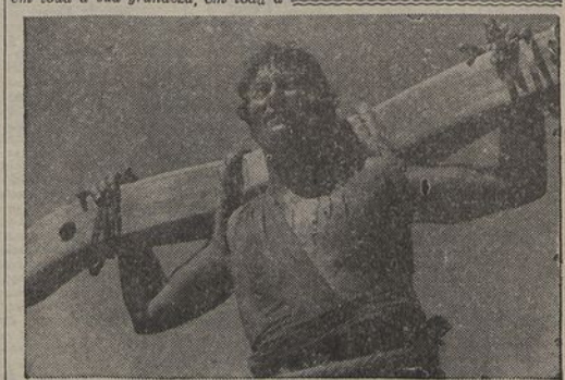
Uma das cenas mais emocionantes de «O Conquistador», que amanhã se estreia em sessão de gala, no Monumental. John Wayne, o famoso Genghis Khan, sob o juízo, revela-nos um episódio pouco conhecido da vida do grande génio militar de Antiguidade