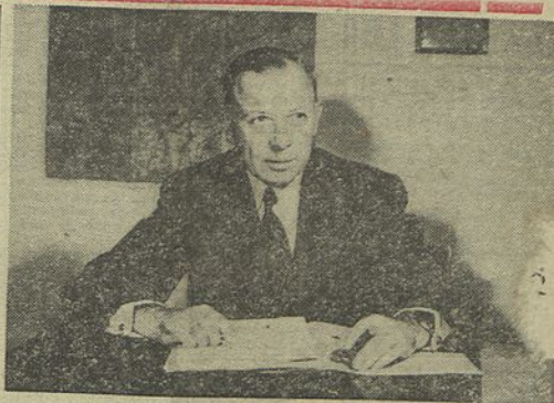
O general Heusinger, falando aos jornalistas portugueses