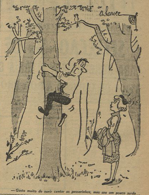
— Gosto muito de ouvir cantar os passarinhos, mas sou um pouco surdo...