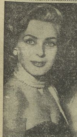
O rosto expressivo de Miroslava Stera, a nova revelação de Hollywood, apresentada como mulher fatal no filme «Festa do Amor e da Morte», rodado no México, tendo como esparto, naíra o actor-Mel Ferrer