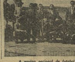
A equipa nacional de futebol que partiu hoje para a Escócia