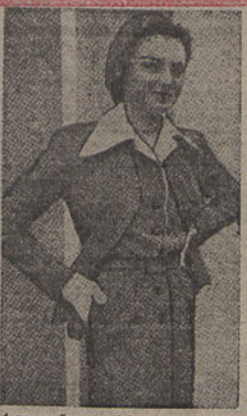
A recepção aos visitantes estrangeiros no Festival da Grã-Bretanha será confiada a raparigas de esmeralda educação designadas pelo nome de «Secretas de Londres», que usarão o uniforme, desenhado por um grande figurinista inglês, e de que se vê na gravura o modelo

Não lhes será possível gastar esse dinheiro na Coreia. — (R.)