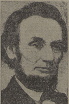
Comemora-se amanhã, nos Estados-Unidos, o 87.º aniversário do célebre discurso proferido por Lincoln, no cemitério nacional de Gettysburg, quando a América sofria os horrores da guerra civil, e que é considerado uma das mais expressivas manifestações do alto espírito do grande Presidente, sem dúvida uma das figuras mais notáveis da grande nação americana