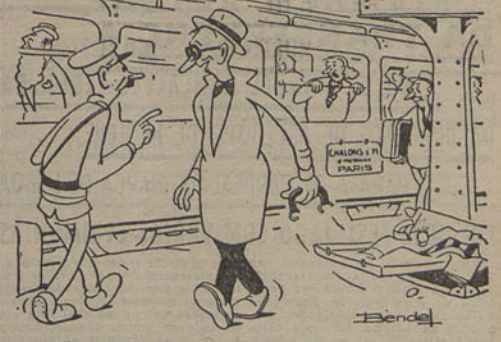
— Quer que lhe leve a bagagem? — Não, não pesa nada...