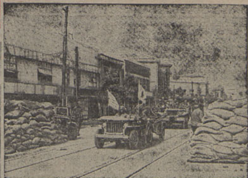
Por entre barricadas nas ruas de Pyongyang, que foi sede do Governo comunista da Coreia do Norte, unidades da 1.ª Divisão de Cavalaria dos Estados- Unidos seguem a caminho da frente de batalha

Realiza-se amanhã, às 16 horas, na rua Alves Correia, 86, 1.º, uma «matinée» dançante, com a colaboração do conjunto musical do «Alecrrim-Bar», a favor de uma pianista cega.