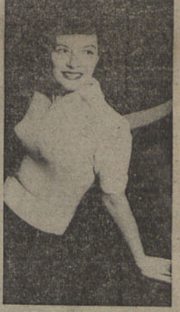
A MODA EM INGLATERRA — Conjunto de saia e camisola de malha feita à mão, apresentado numa recente exposição em Londres

de Mussolini, é a primeira vez que os chefes dos Governos dos dois países que formavam o «Eixo» se encontram; a primeira vez que Adenauer deixa a Alemanha, a primeira vez, também, que De Gasperi recebe oficialmente, em Roma, o chefe de um Governo estrangeiro. Assistiremos ao primeiro passo para a formação de um novo «Eixo»? As condições são favoráveis: — A analogia ideológica entre os dois Partidos que se encontram no poder na Itália e na Alemanha Ocidental. São estes, efectivamente, os dois únicos países da Europa onde a Democracia Cristã governa e ocupa a presidência do Conselho. — As economias dos dois países são complementares. — A Alemanha é, tradicionalmente, o melhor cliente da Itália, e a ideia de uma união aduaneira italo-alemã, encontraria, certamente, menos obstáculos, do que a que se pensou e negociou durante anos, entre a Itália e a França. — Os dois países sofrem do (Continua na 9.ª pag.)