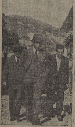
O sr. Ministro das Obras Públicas observando as obras da ponte sobre o Tejo, em Vila Franca de Xira

Não houve cerimónia a assinalar o acontecimento. Porque