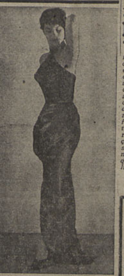
Parece uma estátua, este lindo modelo, que apresenta um sugestivo traje de noite, denominado «Lotus azul»

DJAKARTA, 4 — Um comunicado oficial anunciou que a cidade de Amboina está nas mãos das tropas indonésias e que os combates cessaram em toda a ilha. Confirma, assim, a declaração do Ministro dos Negócios Estrangeiros. — (F. P.)