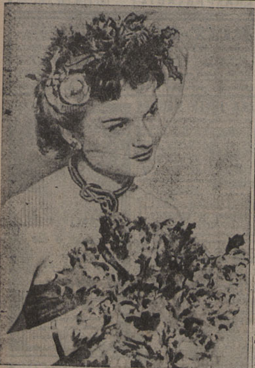
Jean Barthel, um chapelleiro francês, lançou este ano o modelo «árvore de Natal», ideia que agradará, por certo, a todas as senhoras elegantes. É simples a maneira de o realizar e vamos fazer a explicação. Sobre a cabeça coloca-se uma rede escura. E nela que se apregam, raminhos de pinheiro, bem verdes, e de azeitão. Dois destes, colocados nos lados do chapéu têm nos extremos pequenas esferas vermelhas. E uma bola de vidro ou uma estrela completam o conjunto, na verdade, muito bello e original, e muito «natal»