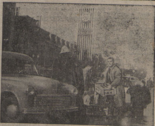
As dádivas dos automobilistas e de empresas particulares começaram a surgir, logo de manhã, nos cinco postos da capital

DE AUTOMOBILISTAS E EMPRESAS PARTICULARES