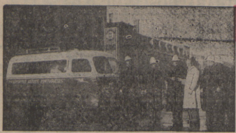
A viatura dos T. A. P. junto do posto dos Restauradores, no momento em que foram entregues os títulos das viagens aéreas entre Lisboa e Porto, destinadas aos sineleiros