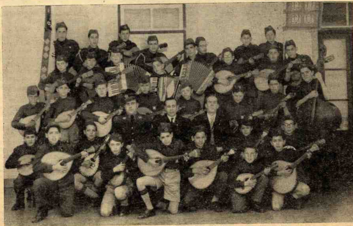
O Conjunto Instrumental do Centro