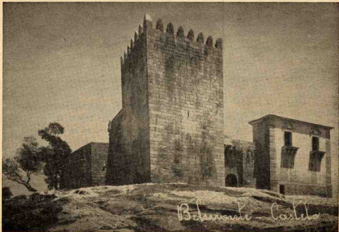
O Castelo de Belmonte, terra natal do descobridor do Brasil