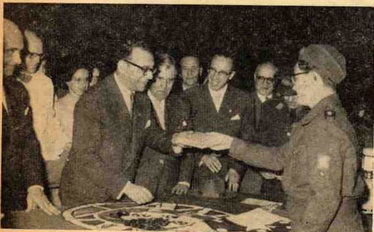
A entrega dos prémios pelo Subsecretário de Estado da Educação Nacional

de Ensino e muitas centenas de pessoas que, gentilmente, se deslocaram da Covilhã à Senhora do Carmo.