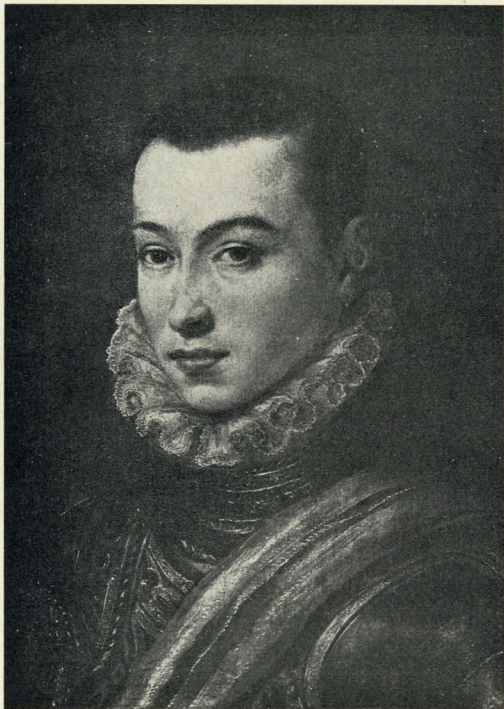
Fig. 1 — RETRATO DE PERSONAGEM DESCONHECIDA — Escola Portuguesa do Século XVI.