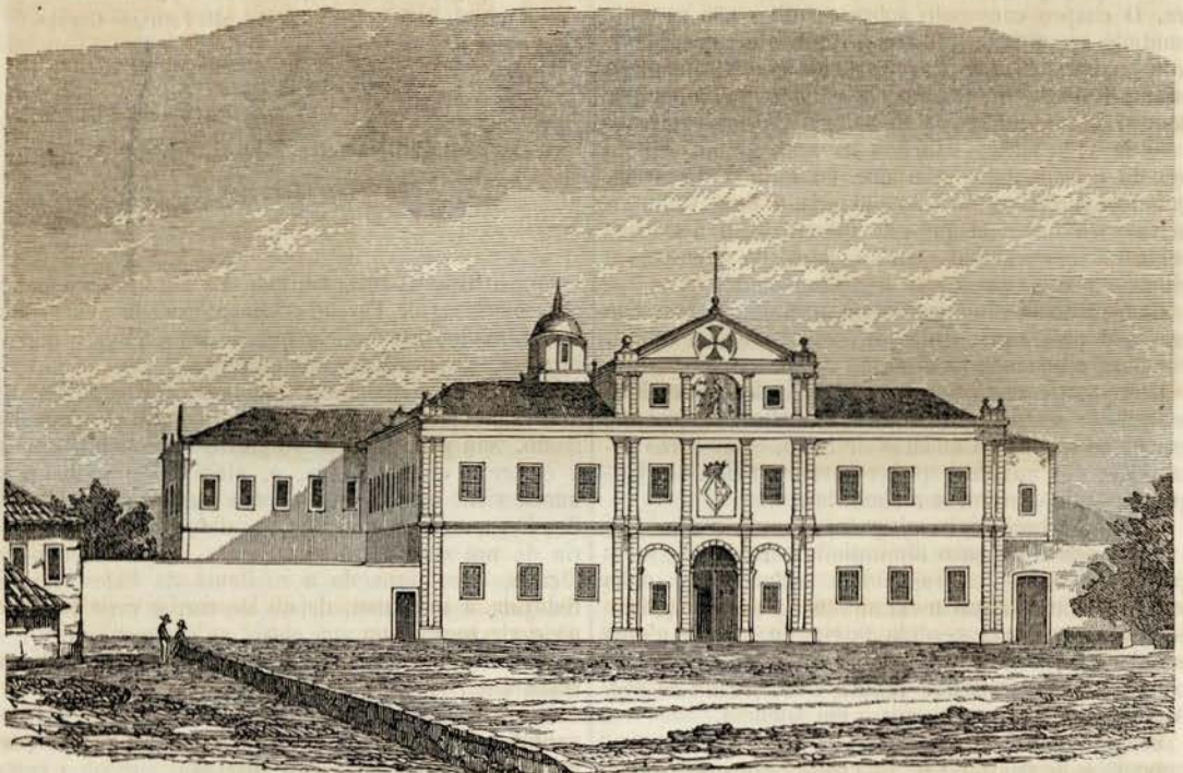
Collegio Militar — Pag. 300

Sebastião de Elcano, mais ditoso do que o valente e engenhoso portuguez, recebeu de Carlos v o galardão da alta façanha, e por divisa de seu brazão o moto que haveria de honrar o escudo de Magalhães, se a fortuna, sempre invejosa dos grandes homens,