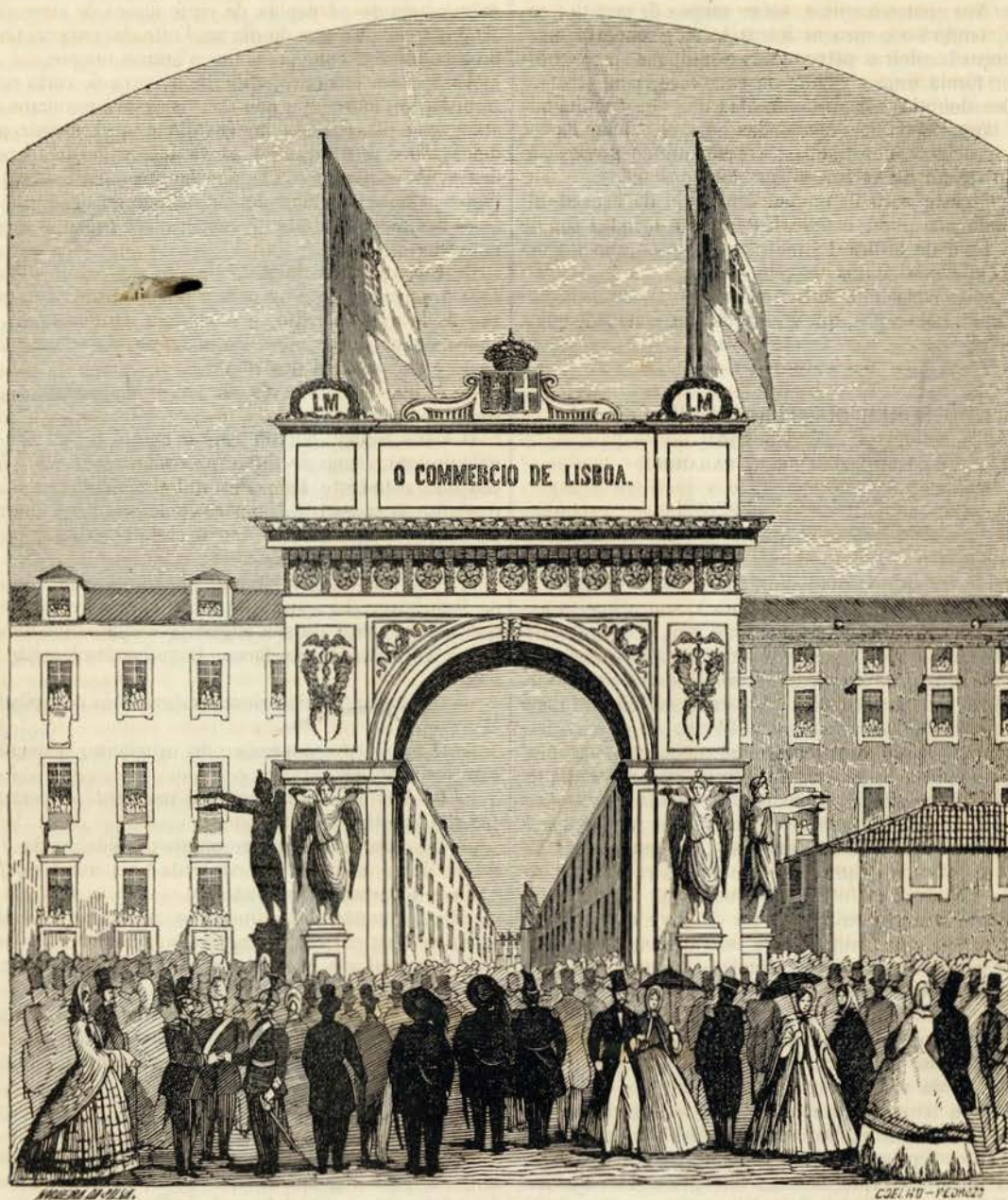
Arco do Commercio — Desenho original de Nogueira da Silva

Depois do pavilhão levantado no Terreiro do Paço pela municipalidade de Lisboa, o mais notavel monumento com que na capital se solemnizou a entrada de S. M. a princeza real de Saboya, foi o arco triumphal que o corpo do commercio mandou erigir no largo do Corpo Santo, sitio por onde passava o cortejo nupcial.