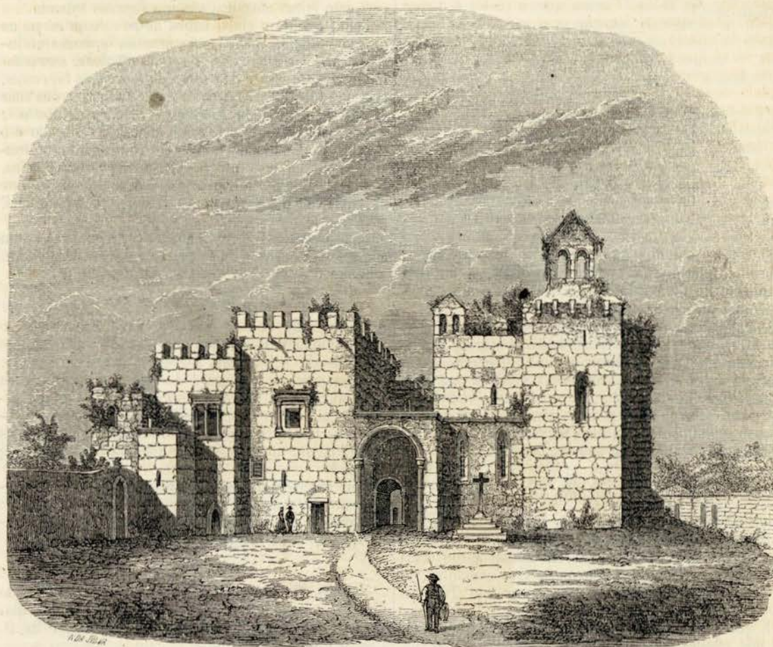
Flor da Rosa — Desenho de Nogueira da Silva, segundo um esboço de Lopes Mendes * — gravura de Pedroso

Ó monstro indigno do meu favor, e do titulo de