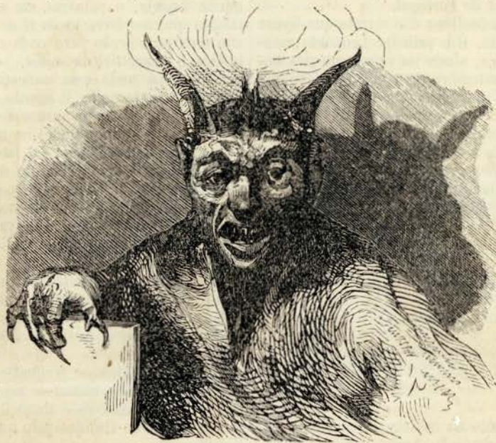
O fradinho ou diabinho da mão furada

Querendo a isto responder Peralta, lh'o impediu a