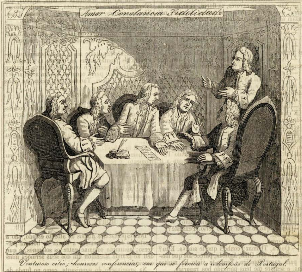
Venturoso cílio; honrosas conferencias, em que se formou a redempção de Portugal.

Azulejo do jardim do palácio dos condes de Almada — Desenho de Nogueira da Silva — Gravura de Pedroso