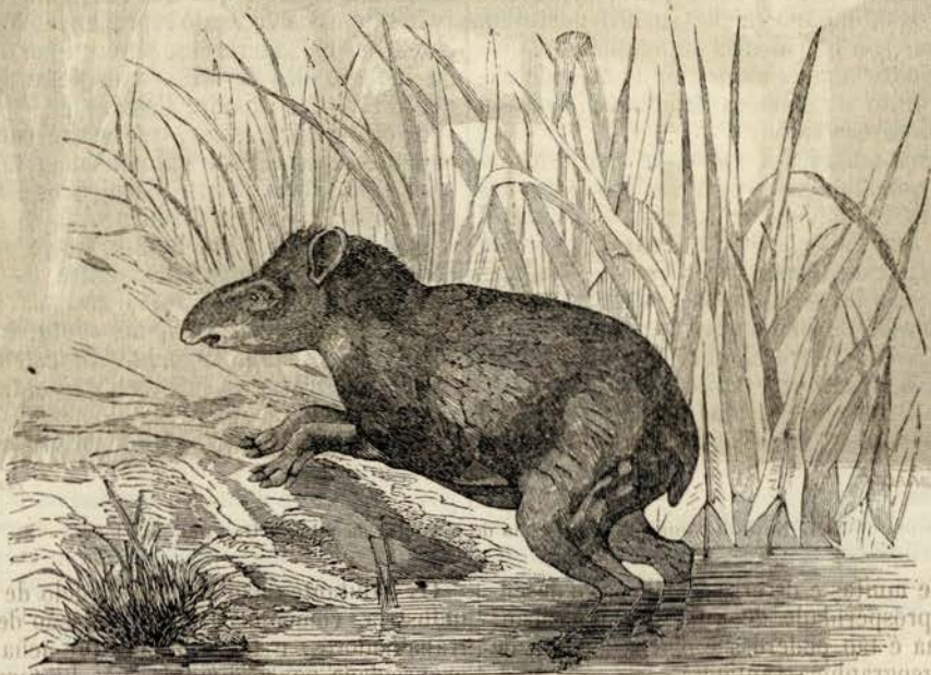
O Tapir ou Anta do Brasil 1

Na vespera do dia da revolução de 1640, andava este segredo já tão publico, que uma criada de D. Antão de Almada, mandando um preto a casa de certa senhora, cujo marido se achava preso e opprimido pelo secretario de estado Miguel de Vasconcellos, chegou a uma janella, estando o preto ainda no pateo, e em alta voz lhe fez esta recommendação: Dize á senhora que se não consuma, porque amanhã ha de ir o sr. D. Antão com outros fidalgos matar o secretario de estado, e soltar o senhor seu marido.