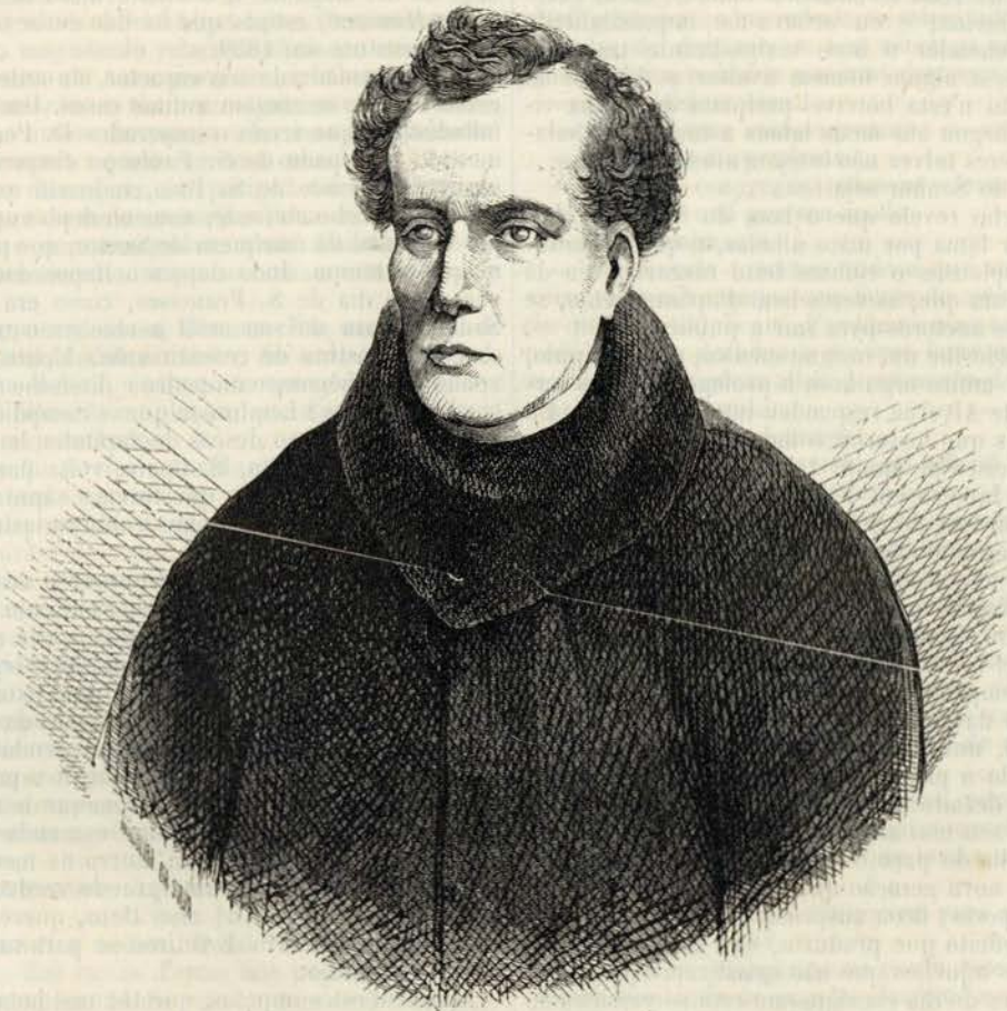
Fr. Francisco de Monte Alverne

O Brasil tem este facundo e austero pregador franciscano na conta de seu Lacordaire. Allí foi sempre applaudido e festejado como o primeiro orador sacro, depois do disserto e mavioso fr. Francisco de S. Carlos e do eloquente e arrebatado fr. Francisco de Sampaio, ambos confrades de Monte Alverne.