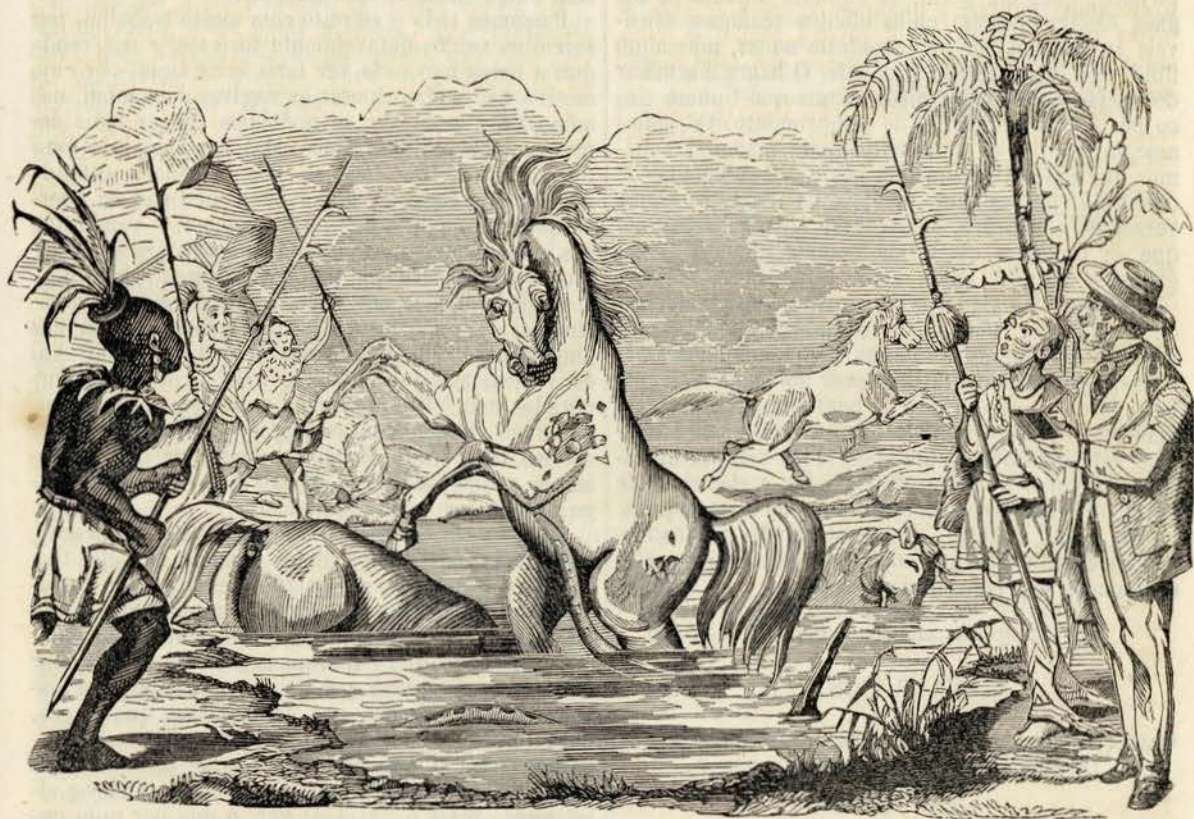
Pesca dos peixes electricos

«Os indios, munidos de harpéos e cannas compri-