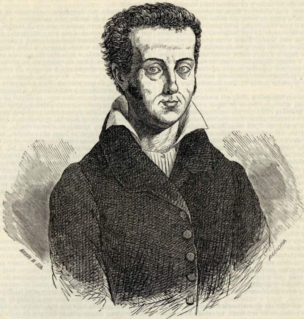
José Ferreira Borges.