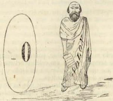
Explicação do enigma do numero antecedente.

Camões em nada é inferior aos mais célebres e afamados poetas estrangeiros; e, ao contrario, superior a todos.