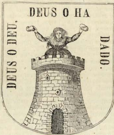
O brazão d'armas da villa de Monção.

Ora destruida, ora reedificada durante essas differentes dominações, no tempo do nosso rei D. Affonso III estava inteiramente arruinada e deserta. Foi então novamente reconstruida e povoada por este soberano, que lhe deu foral em 1261. El-rei D. Diniz, como dissemos, fundou-lhe o castello, e cingiu-a de muros; e D. João II reedificou e augmentou as muralhas. Actualmente conta uns 1:200 habitantes.