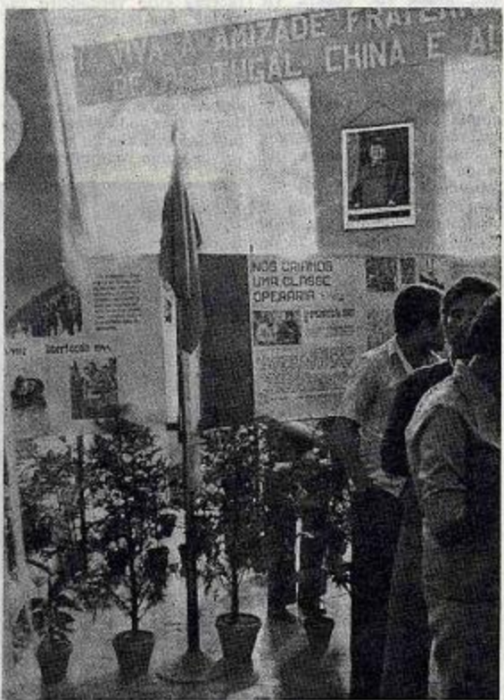
A fotografia do presidente Mao Tsé-tung dominava a sala da exposição

Os seus estatutos prevêem ainda que se deve caminhar no sentido da criação de duas associações de amizade (Portugal-China e Portugal-Albânia) considerando-se a sua presente junção apenas própria a uma primeira fase de arranque.