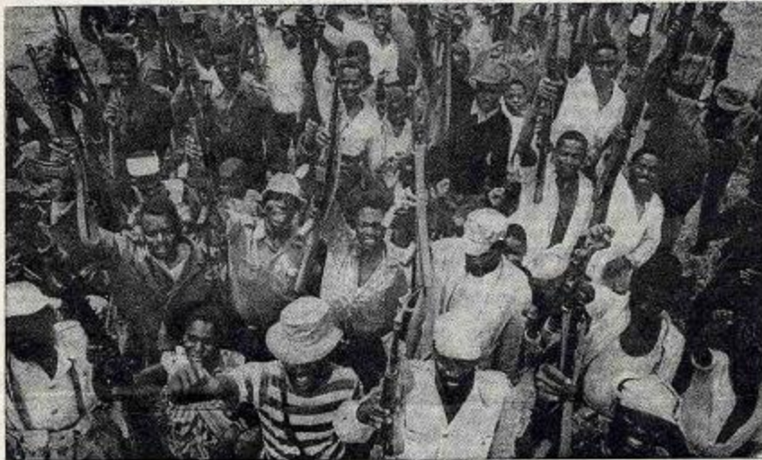
A luta popular armada é invencível!

crecente de países e organizações internacionais.