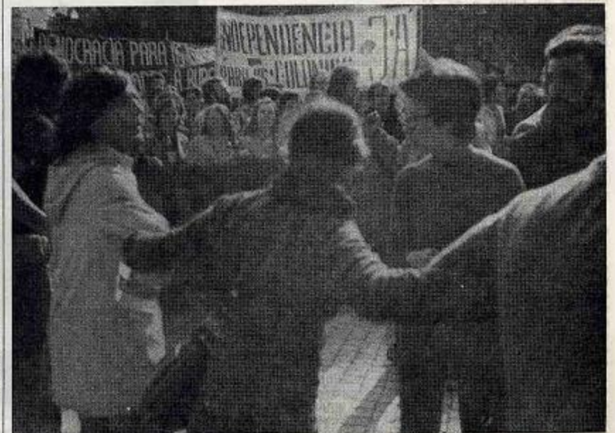
Apoiemos activamente a luta dos povos das colónias

Mas esta reestruturação não podia deixar igualmente de levantar toda uma série de contradições entre sectores e grupos da burguesia —