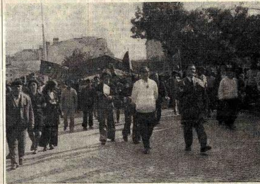
UNIDADE POPULAR — OPERÁRIOS E CAMPONESES UNIDOS VENCERÃO!

Quais são as características fundamentais das actuais lutas pelo Pão? Quais os seus pontos fortes e as suas fraquezas? Que papel têm nelas desempenhado as direcções reformistas dos sindicatos e os partidos e movimentos ditos «democráticos»? Que perspectivas se lhes abrem? Tais são algumas das questões que vamos focar neste artigo.