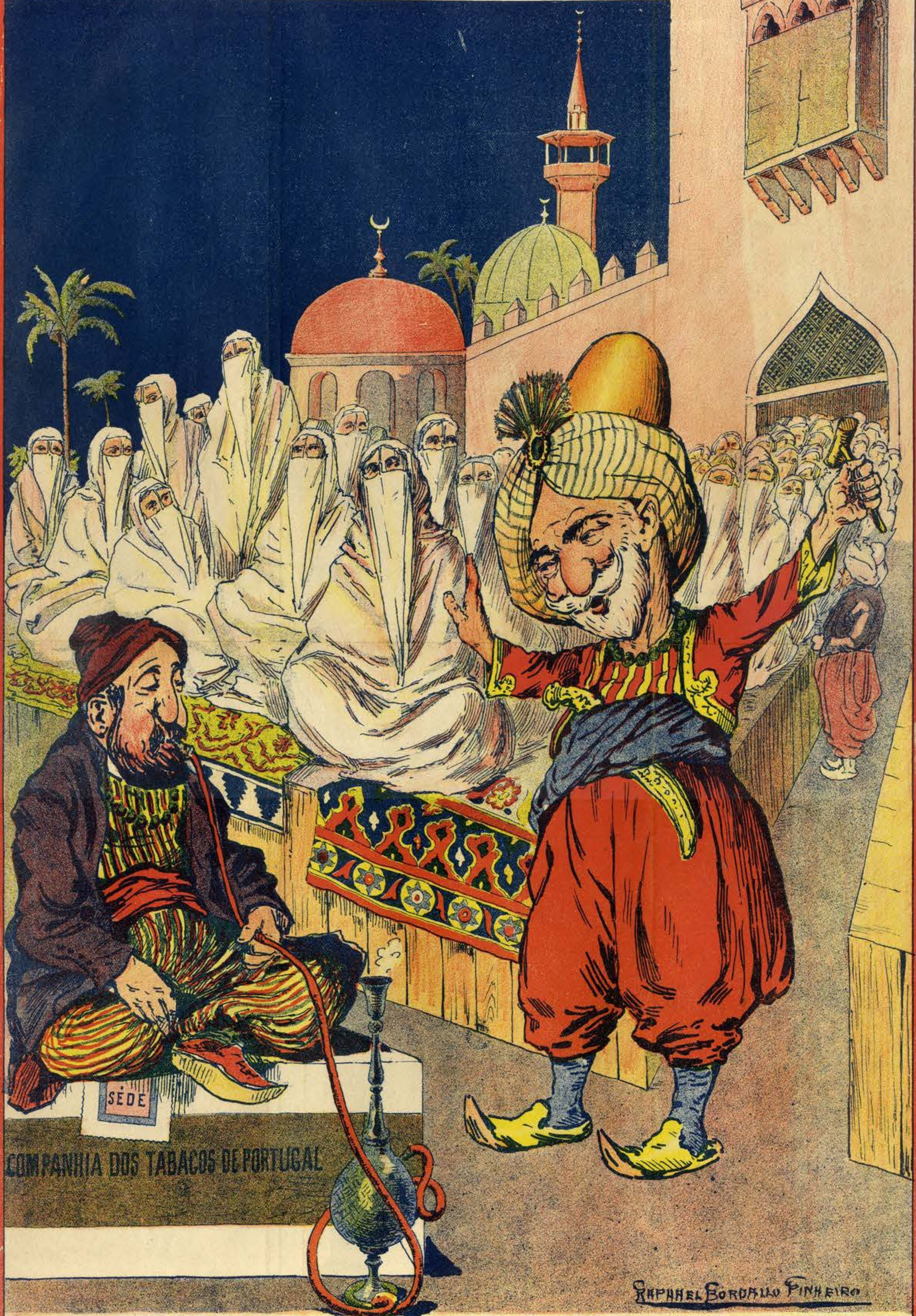
O pregoeiro — Estão á venda 72 mil lindas obrigações dos harems do Ministerio da Fazenda! . . . Seis mil sequins! . . . Vae-se arrematar, meus senhores! Vae-se arrematar!