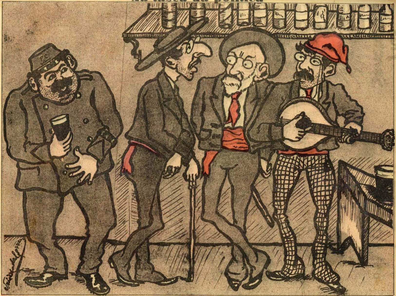
UM CONSELHO DE BACÔCOS NA RUA DOS NAVEGANTES