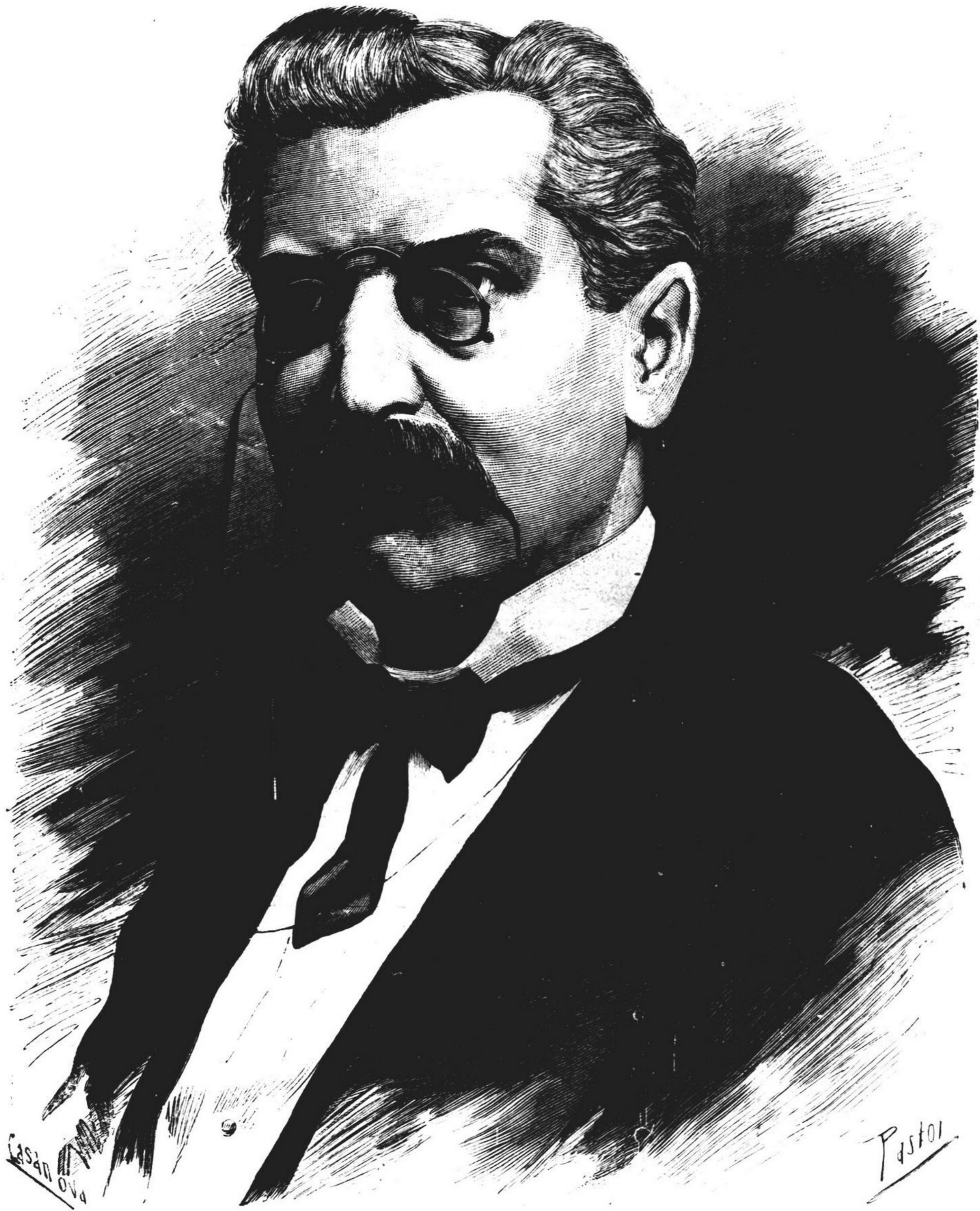
MANUEL PINHEIRO CHAGAS