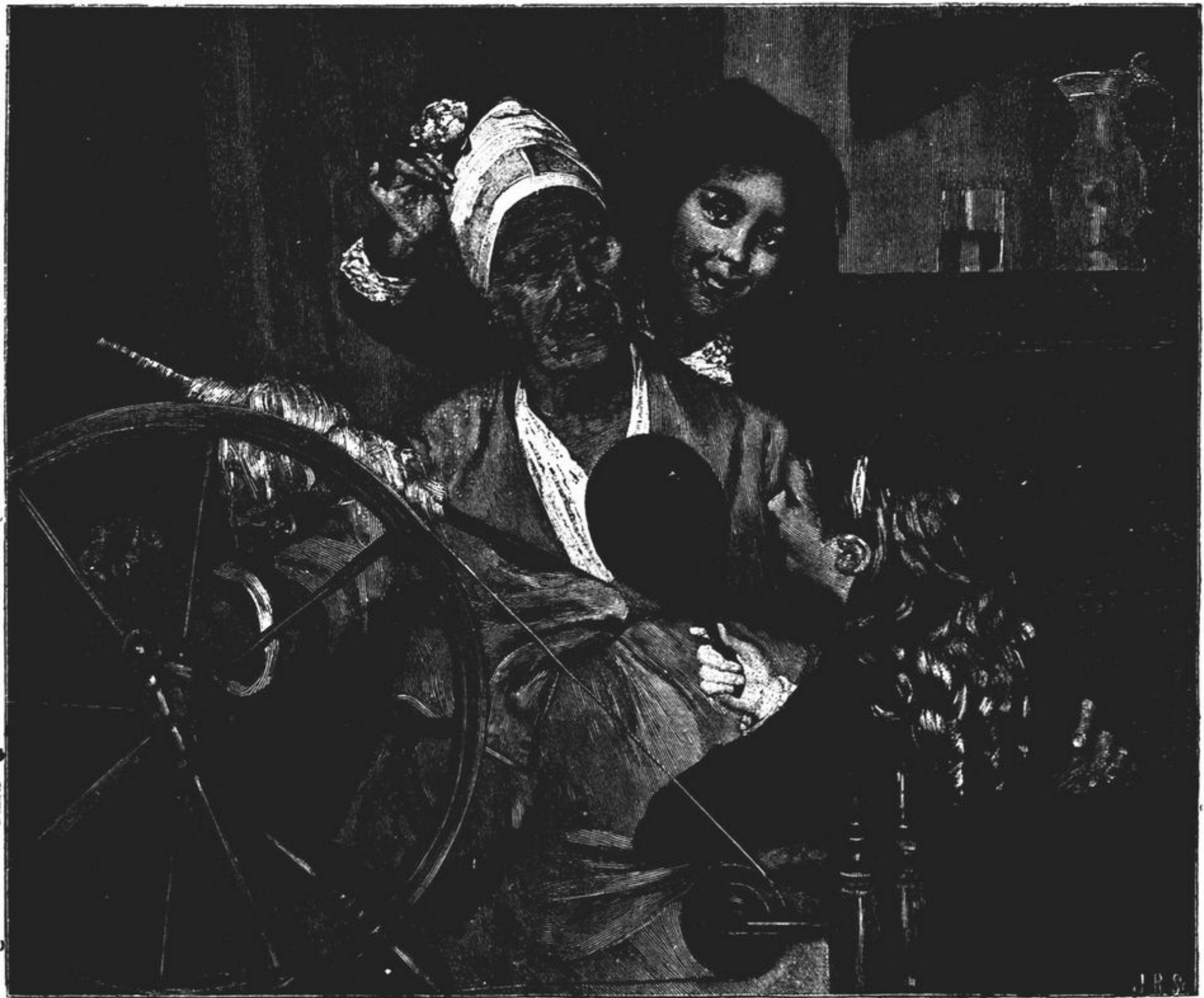
VÊ COMO ESTÁ BONITA?