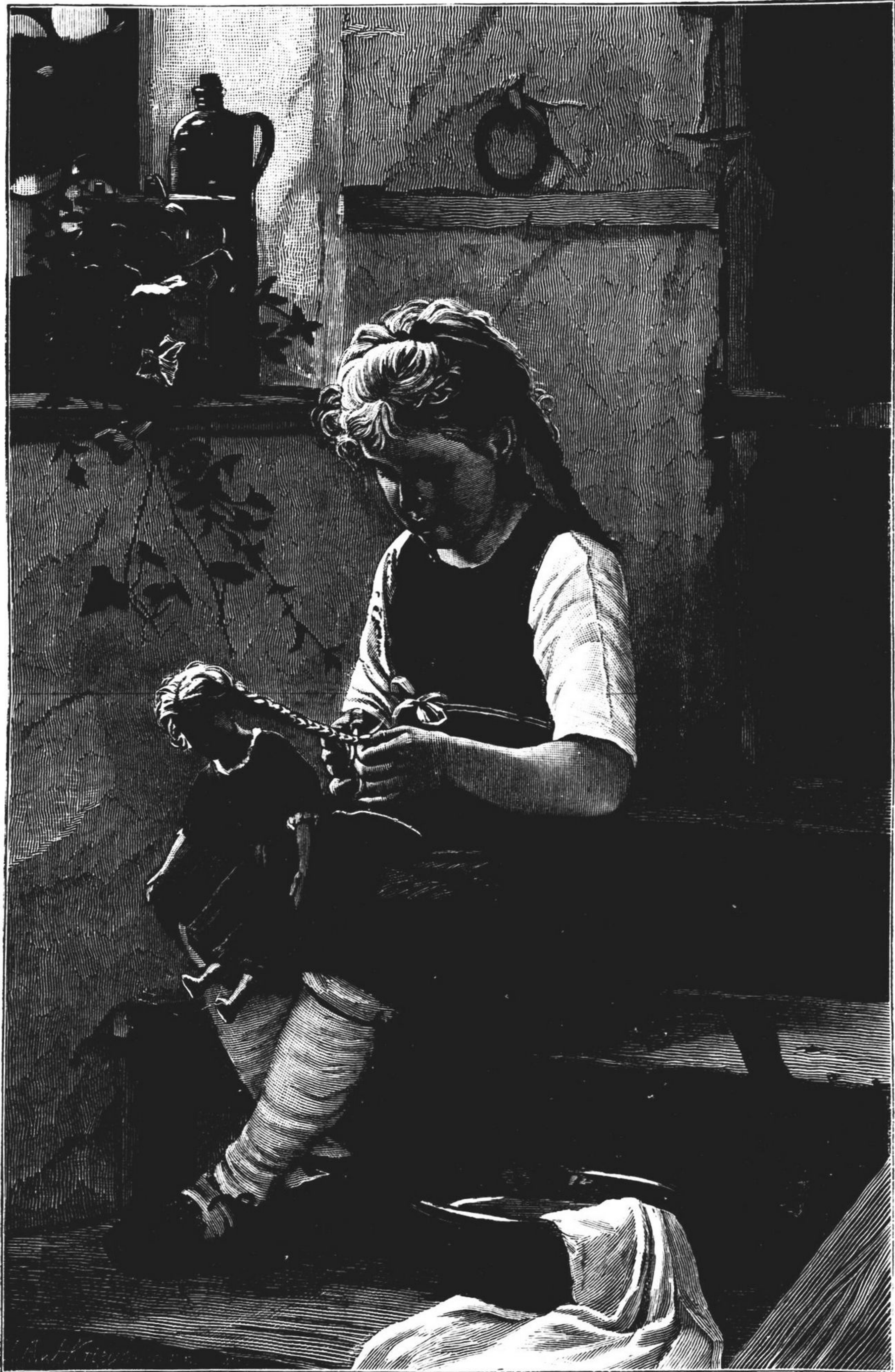
EM TIROCINIO PARA MÃE DE FAMÍLIA