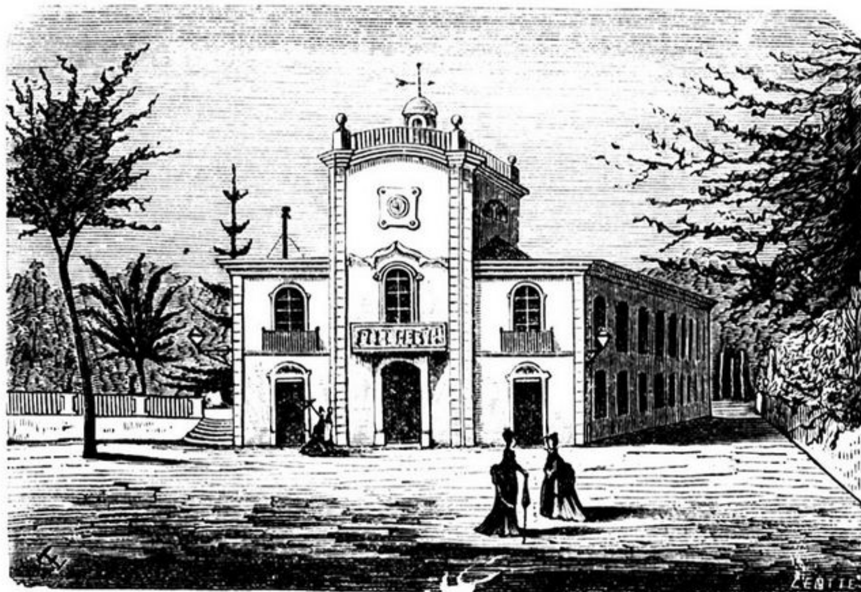
PALACIO DO MONTEIRO-MÓR, NA QUINTA DO LUMIAR

Reservados todos os direitos de propriedade litteraria e artistica