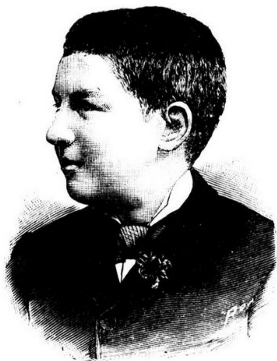
PRINCIPE DE ORLÉANS