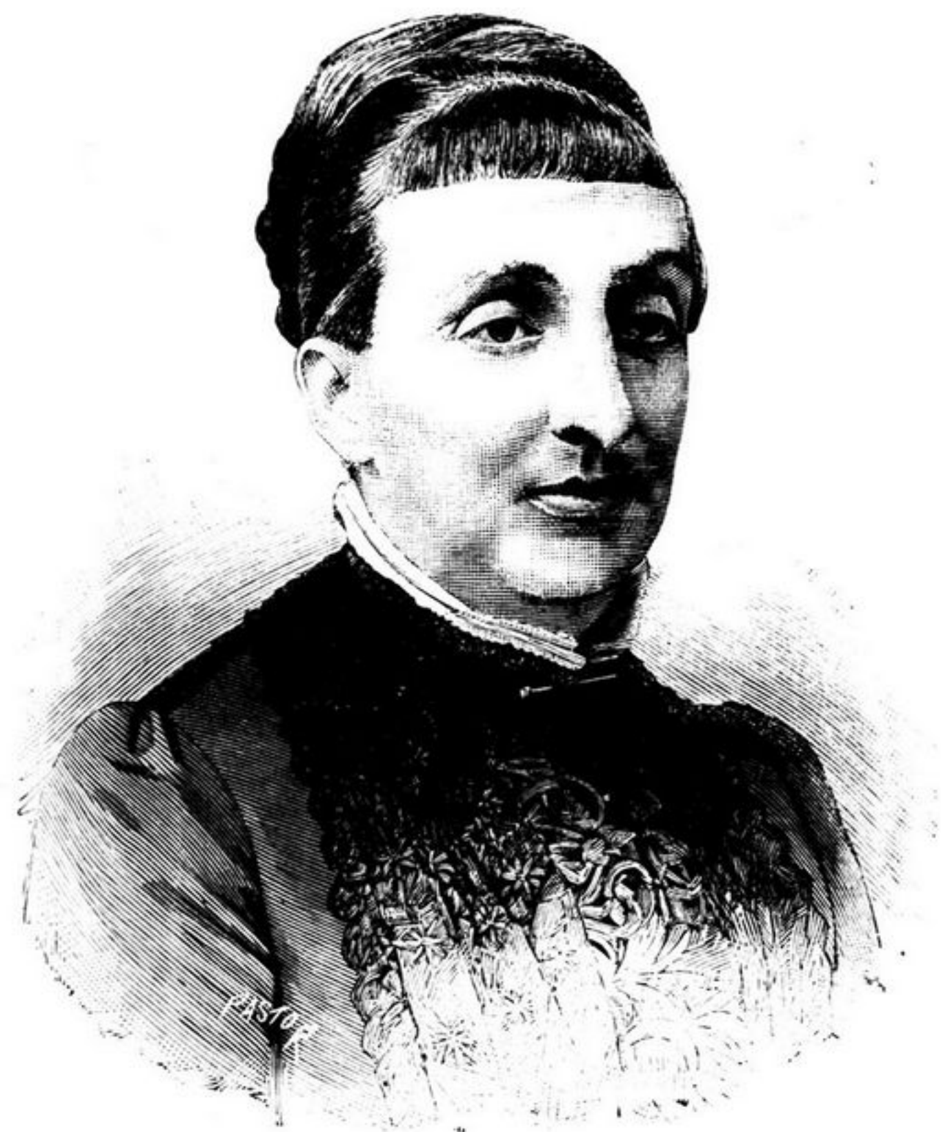
CONDESSA DE PARIS