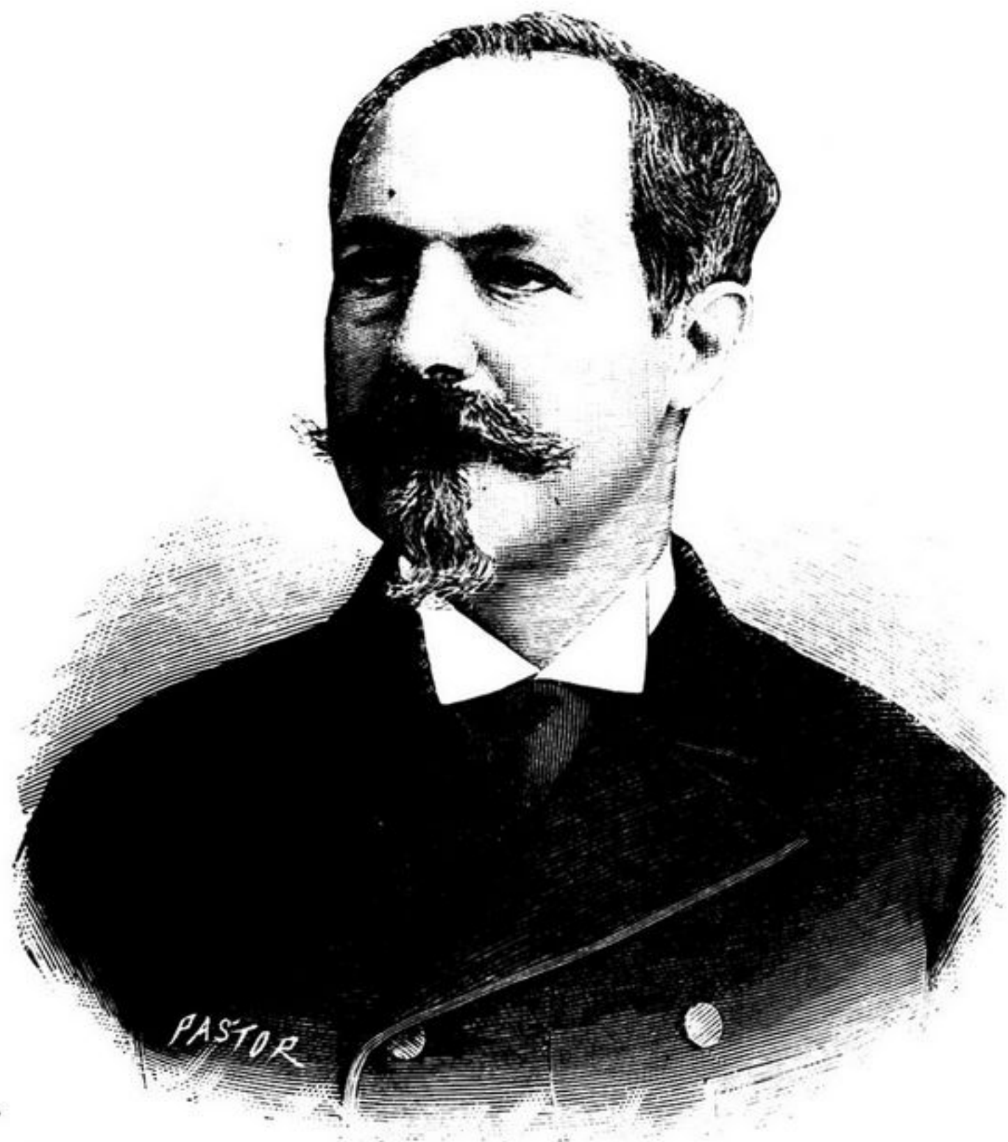
CONDE DE PARIS