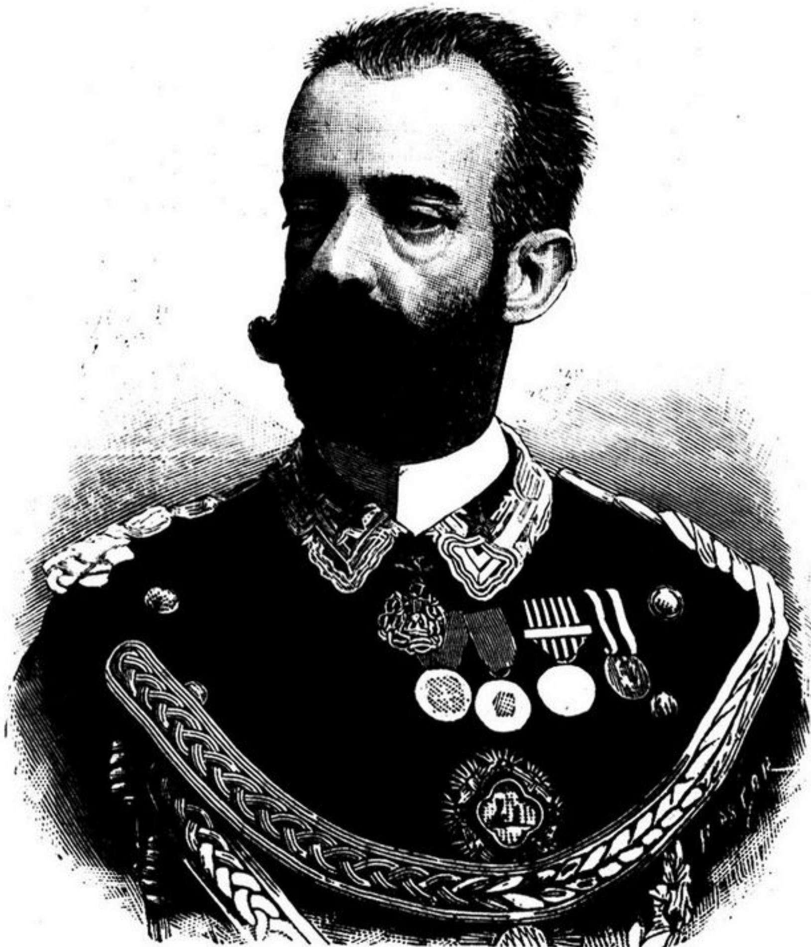
PRINCIPE AMADEU, DUQUE DE AOSTA

Eu creio que os thermometros teem marcado, nos ultimos dias, o maximo dos graos que lhes é permitido accusar sob o calor intenso e suffocante das regiões africanas. Mais além não se póde subir, nem mesmo na zona torrida. Ora, debaixo d'um sol d'estes, toda a compostura de trage é impossivel, por maior desejo que te-