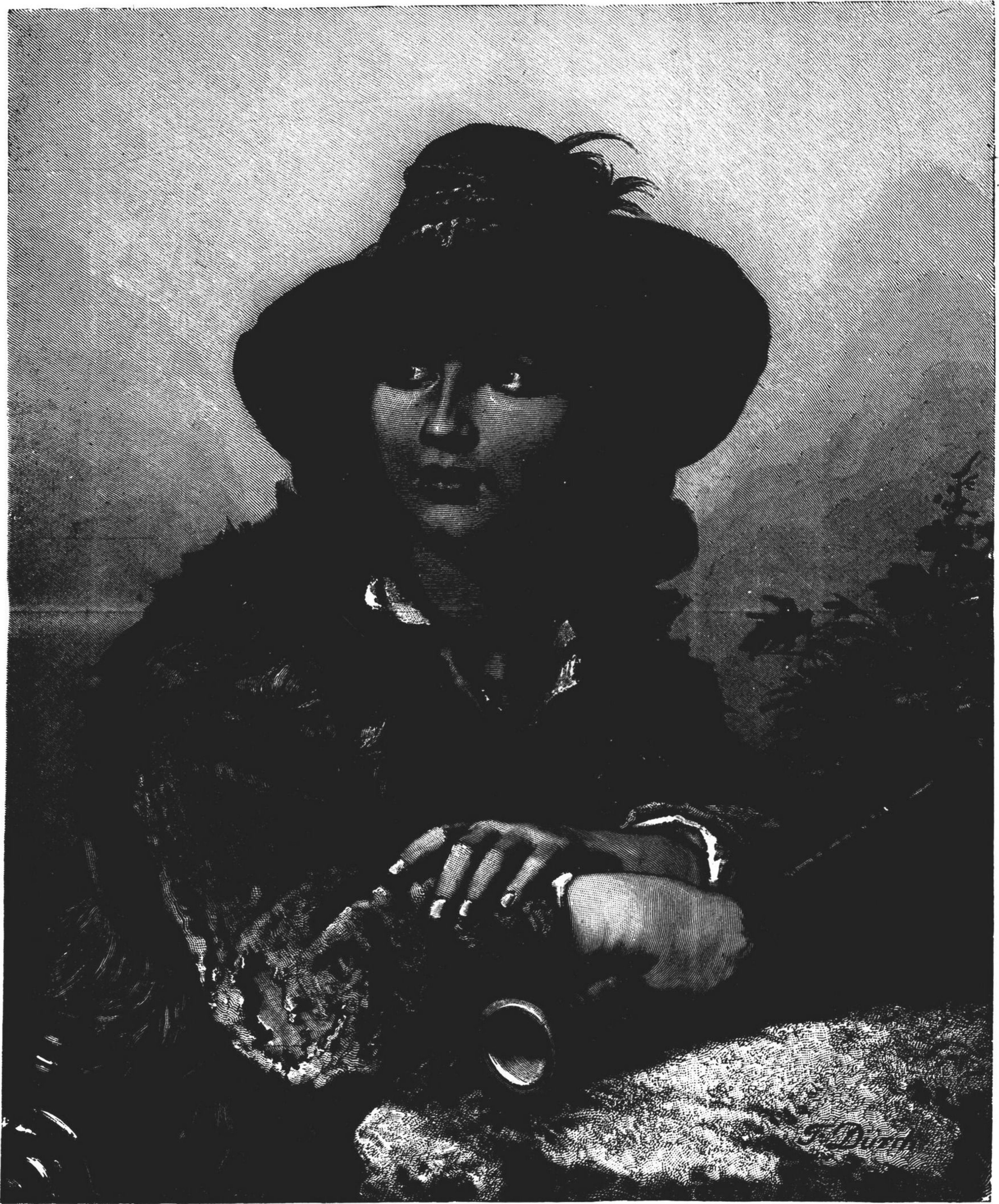
UM PASTOR DA PROVENÇA