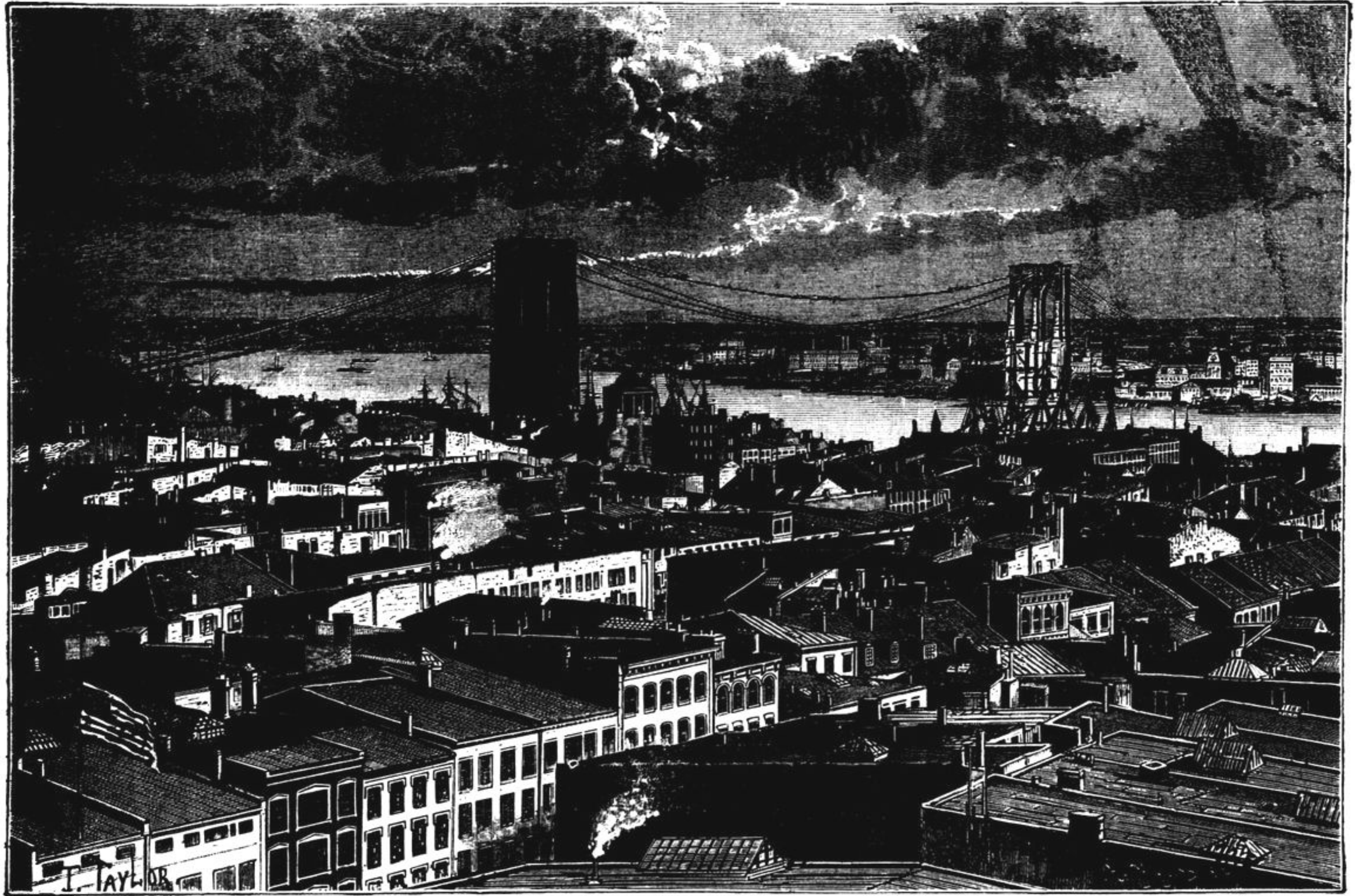
A PONTE DE BROOKLYN, EM NEW-YORK