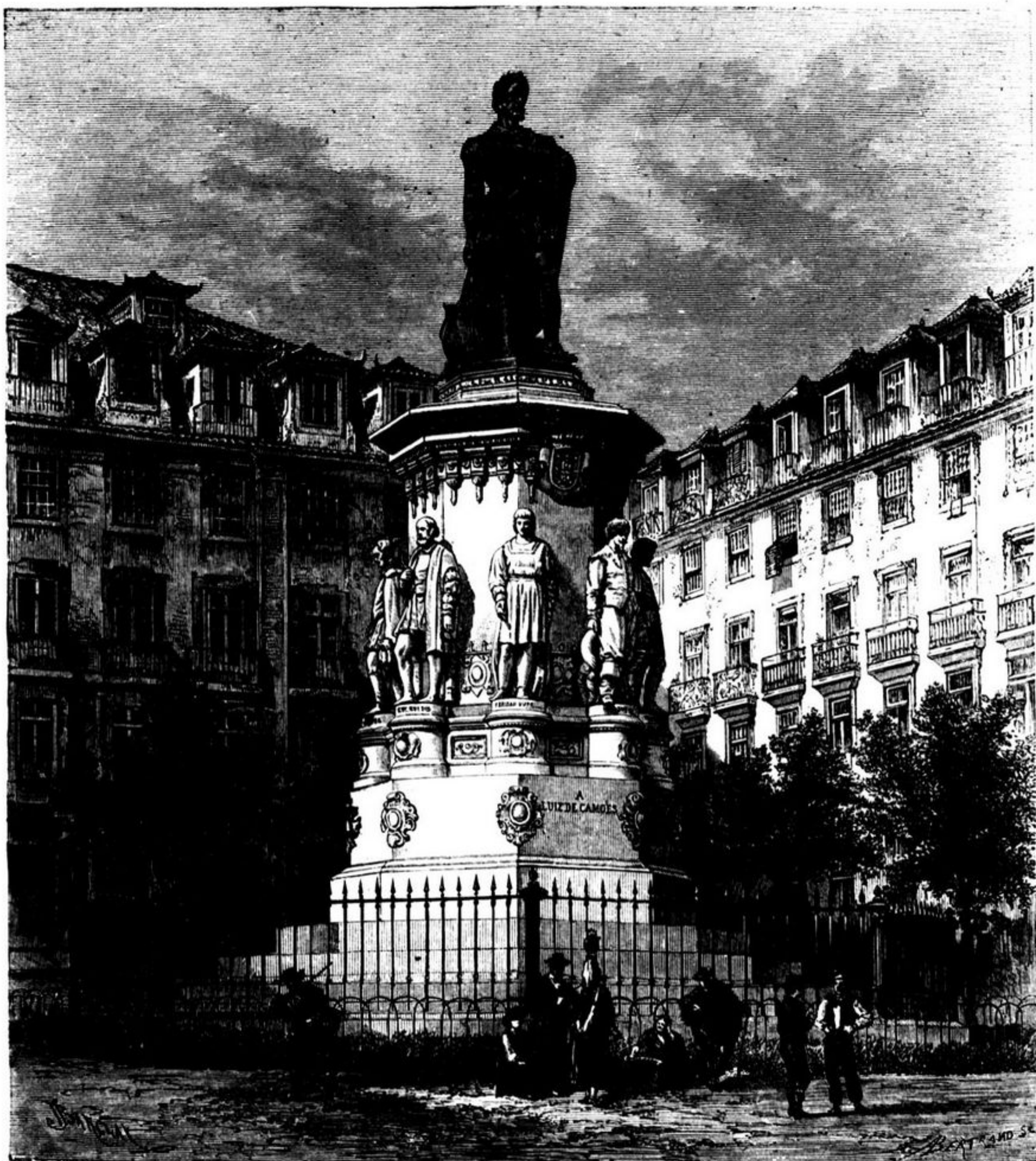
ESTATUA DE LUIZ DE CAMÕES