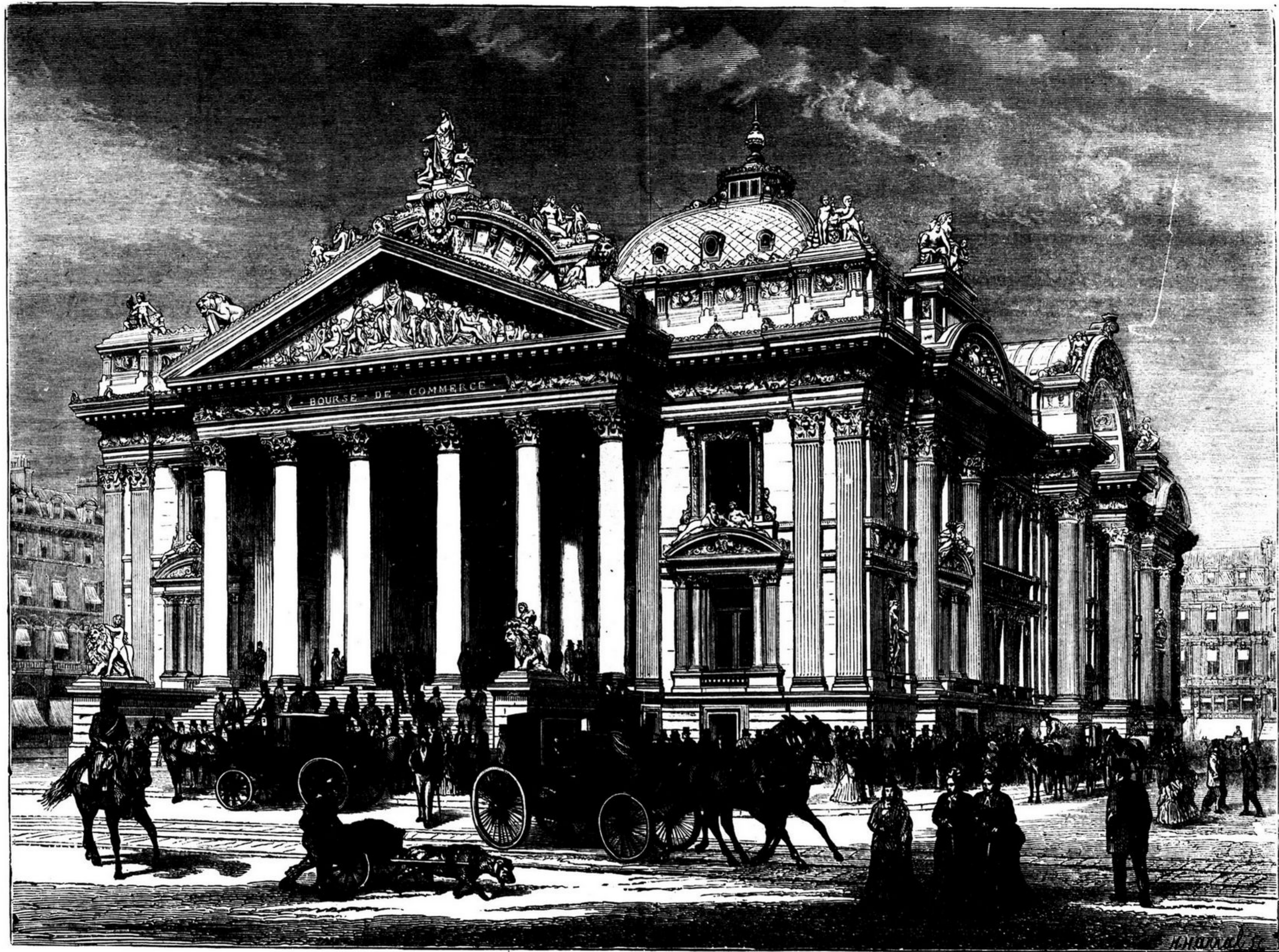
O PALACIO DA BOLSA DE BRUXELLAS