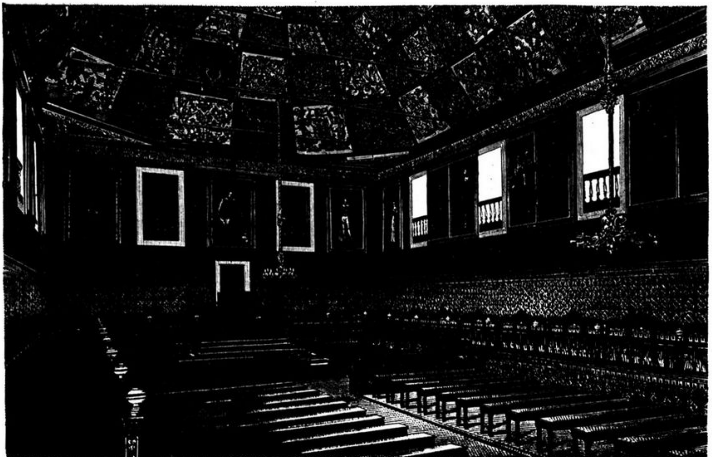
SALA DOS ACTOS GRANDES DA UNIVERSIDADE DE COIMBRA