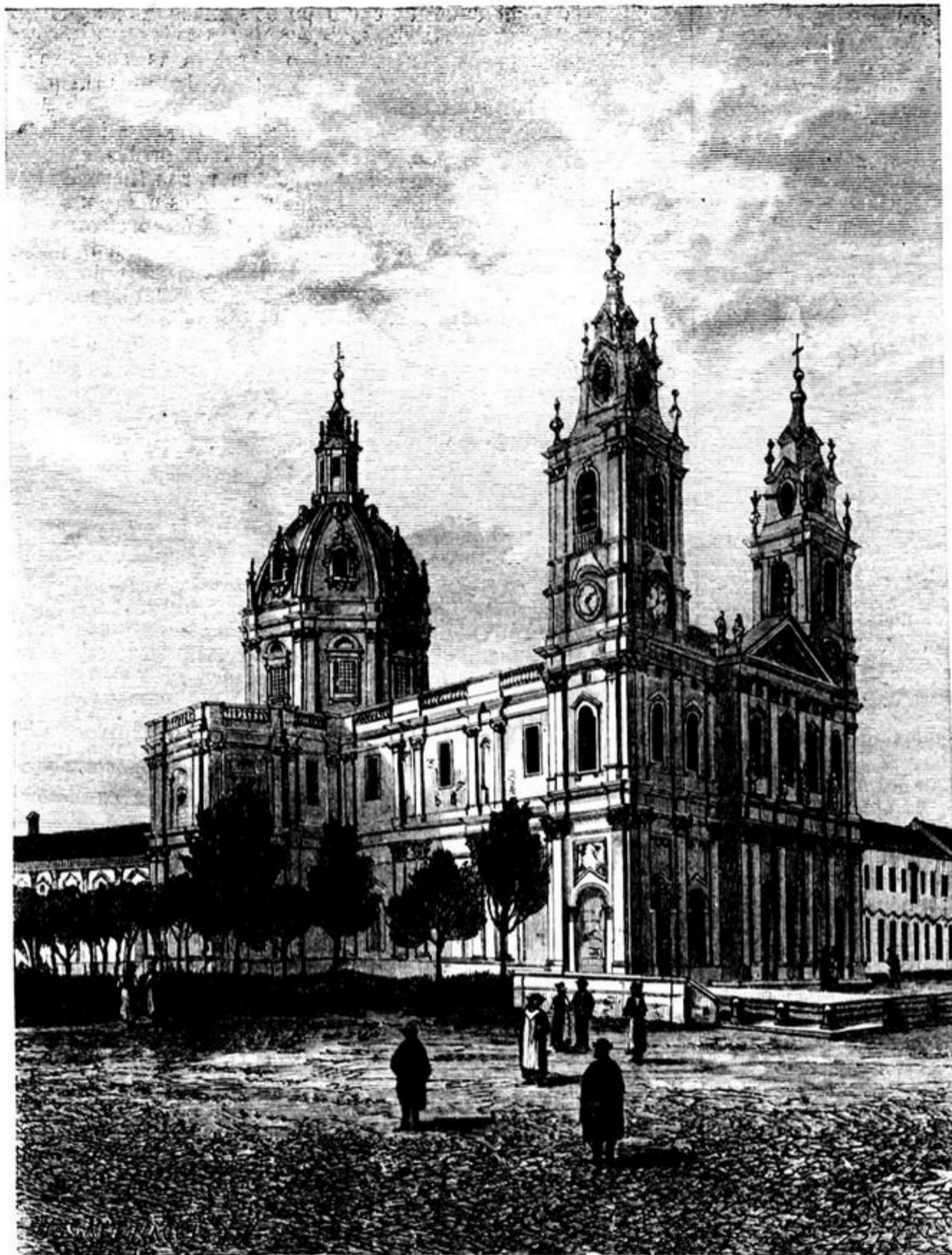
EGREJA E CONVENTO DA ESTRELLA

gresso do mestre ferrador, protestaram a seu modo e puzeram-se em fuga, saltando por cima do unico obstaculo que se lhe depa-rou na frente. Infelizmente, esse obstaculo era o formoso par de namorados, que davam n'aquelle momento á paizagem um tom tão pastoril.