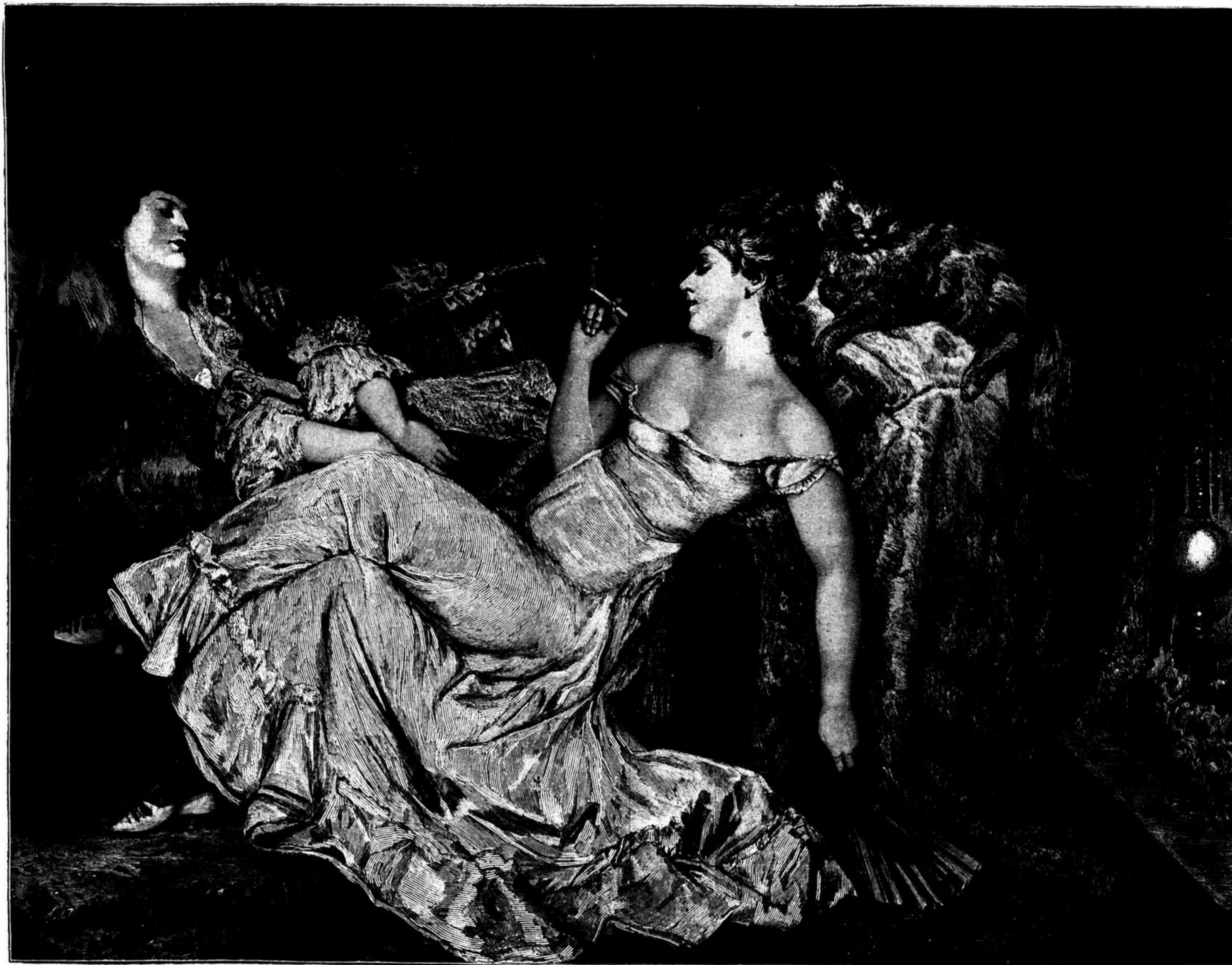
CORAÇÕ ES DE MARMORE