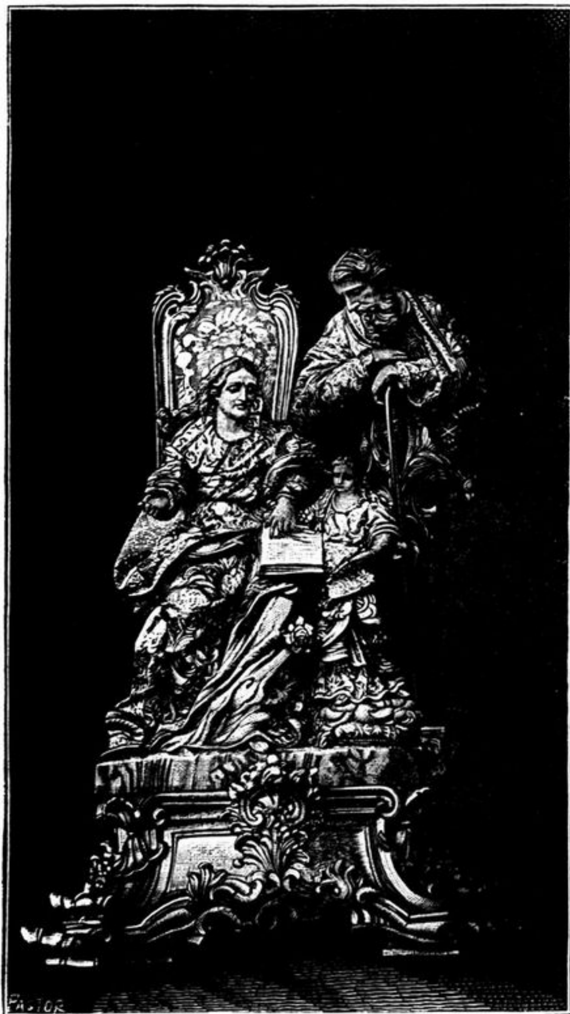
S. JOAQUIM, SANT'ANNA E A VIRGEM ESCUPTURA ATTRIBUIDA A MACHADO DE CASTRO