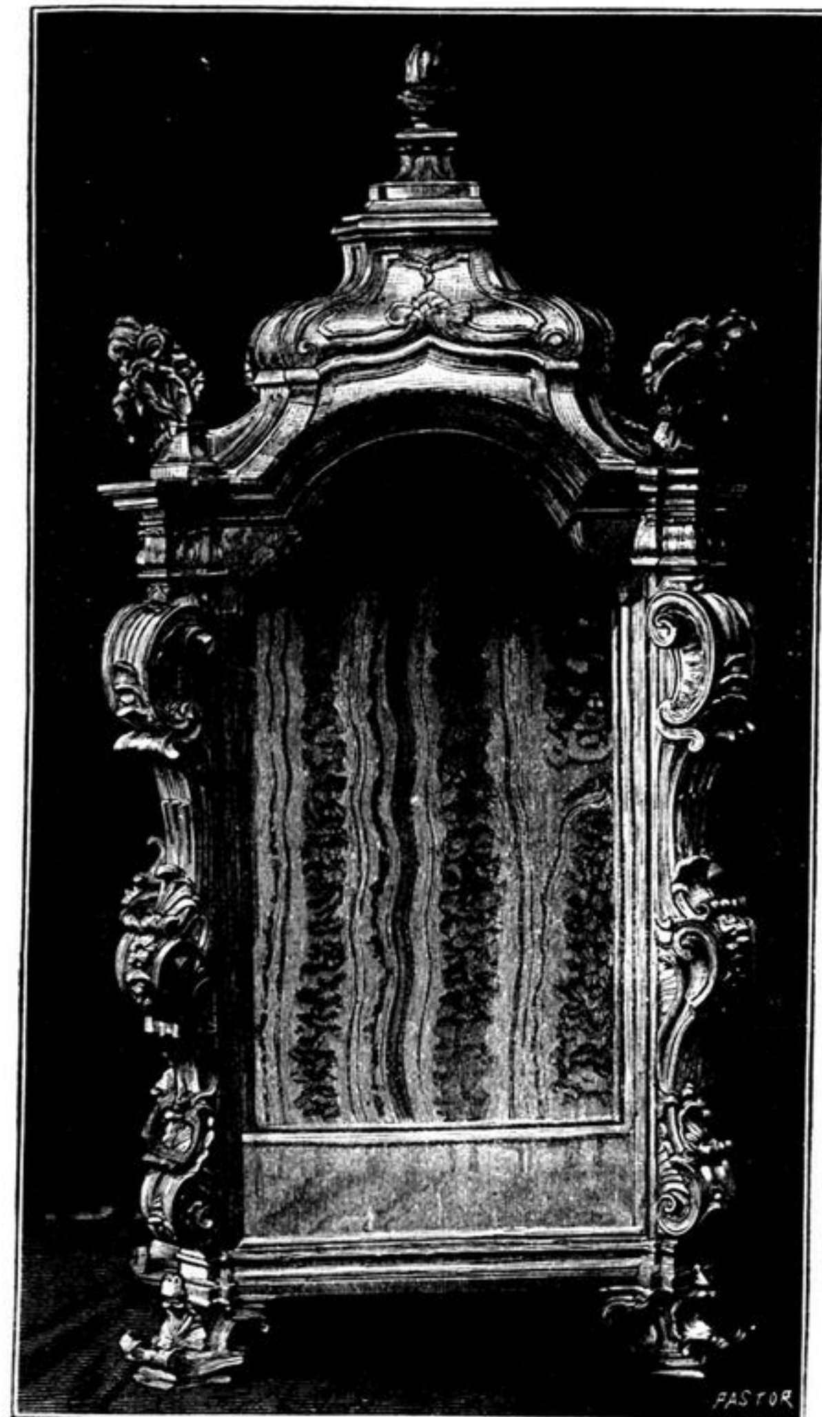
MAQUINETA QUE RESGUARDA A ESCULPTURA