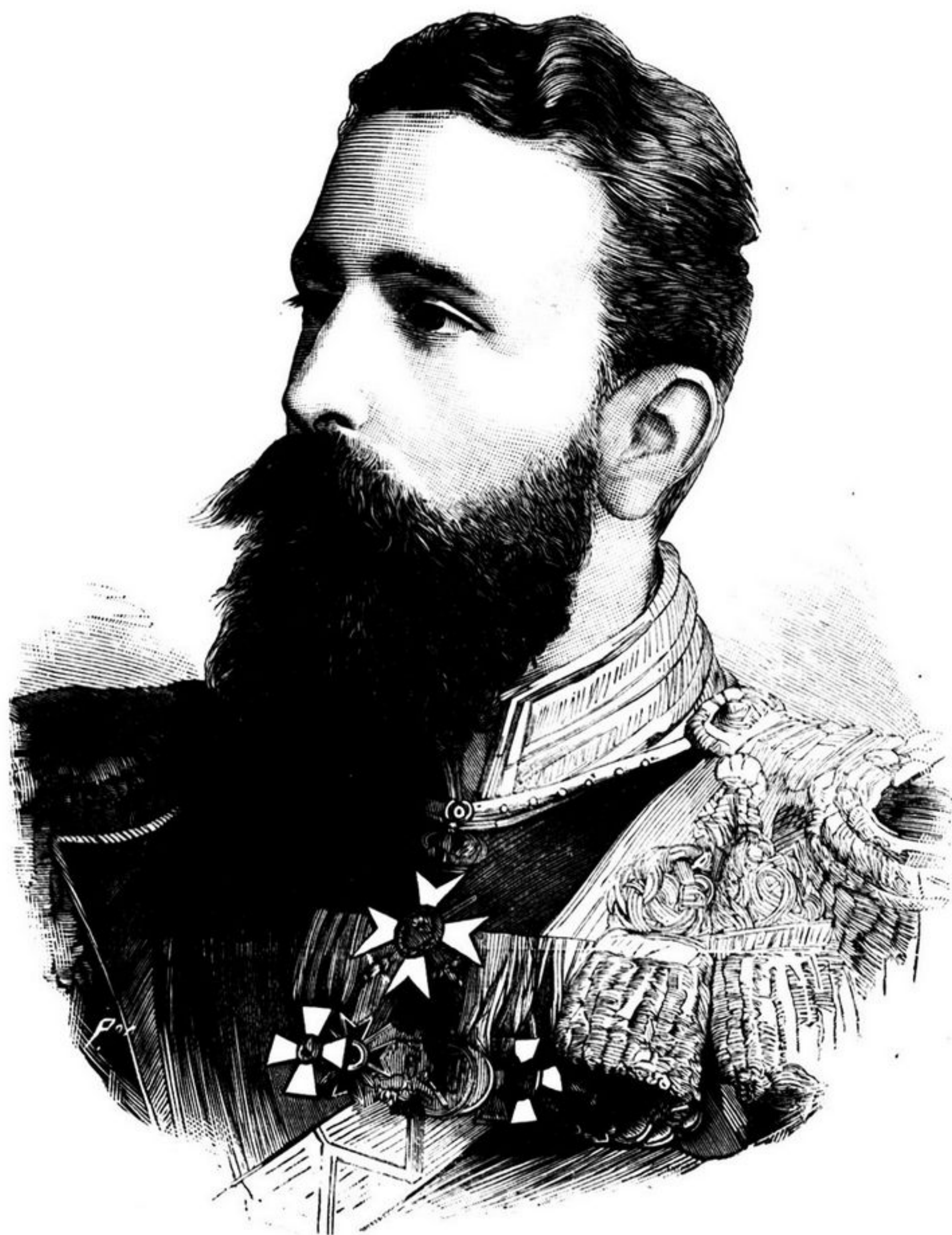
O PRINCIPE ALEXANDRE DA BULGARIA