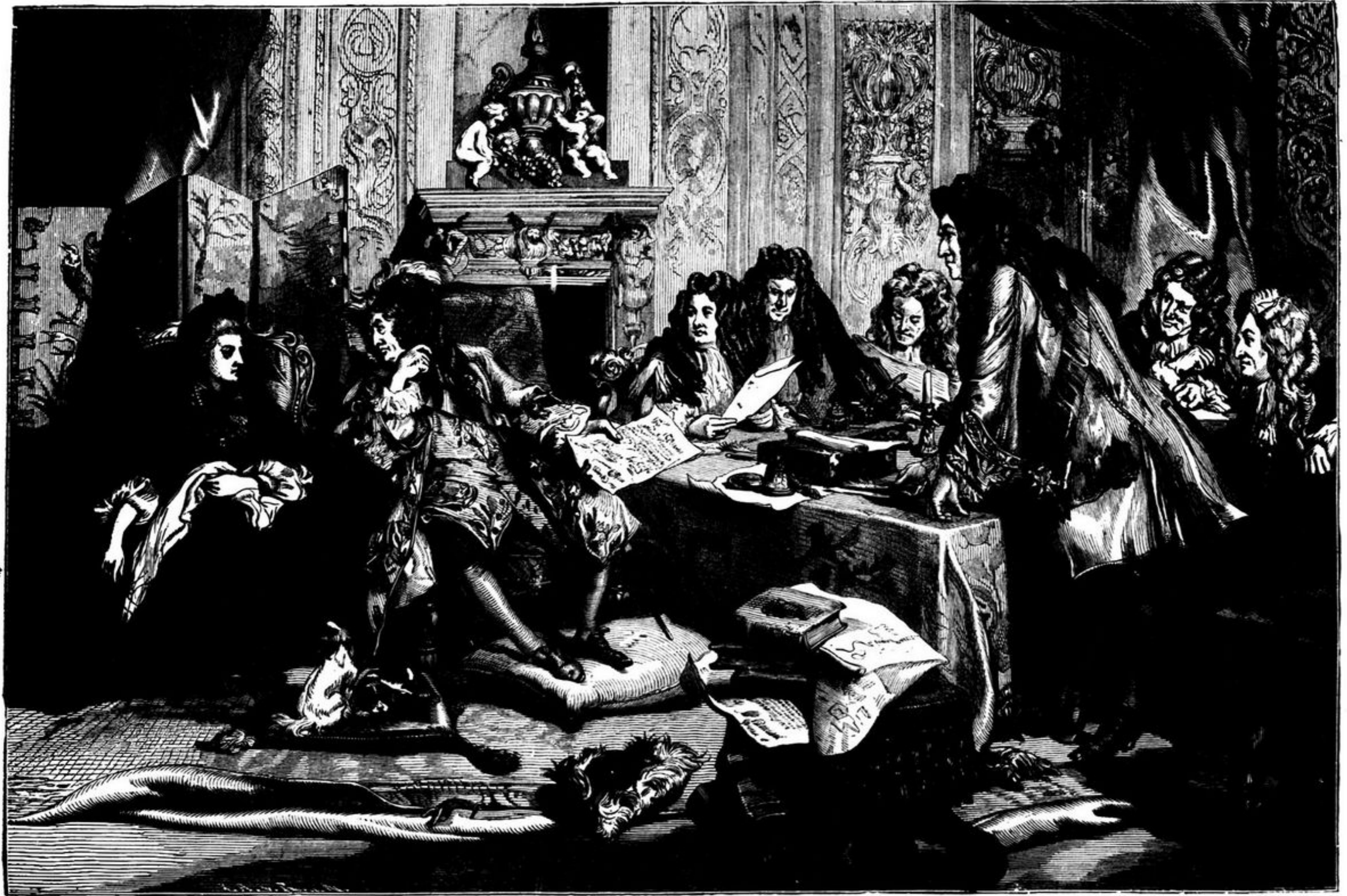
LUIZ XIV E A MAINTENON