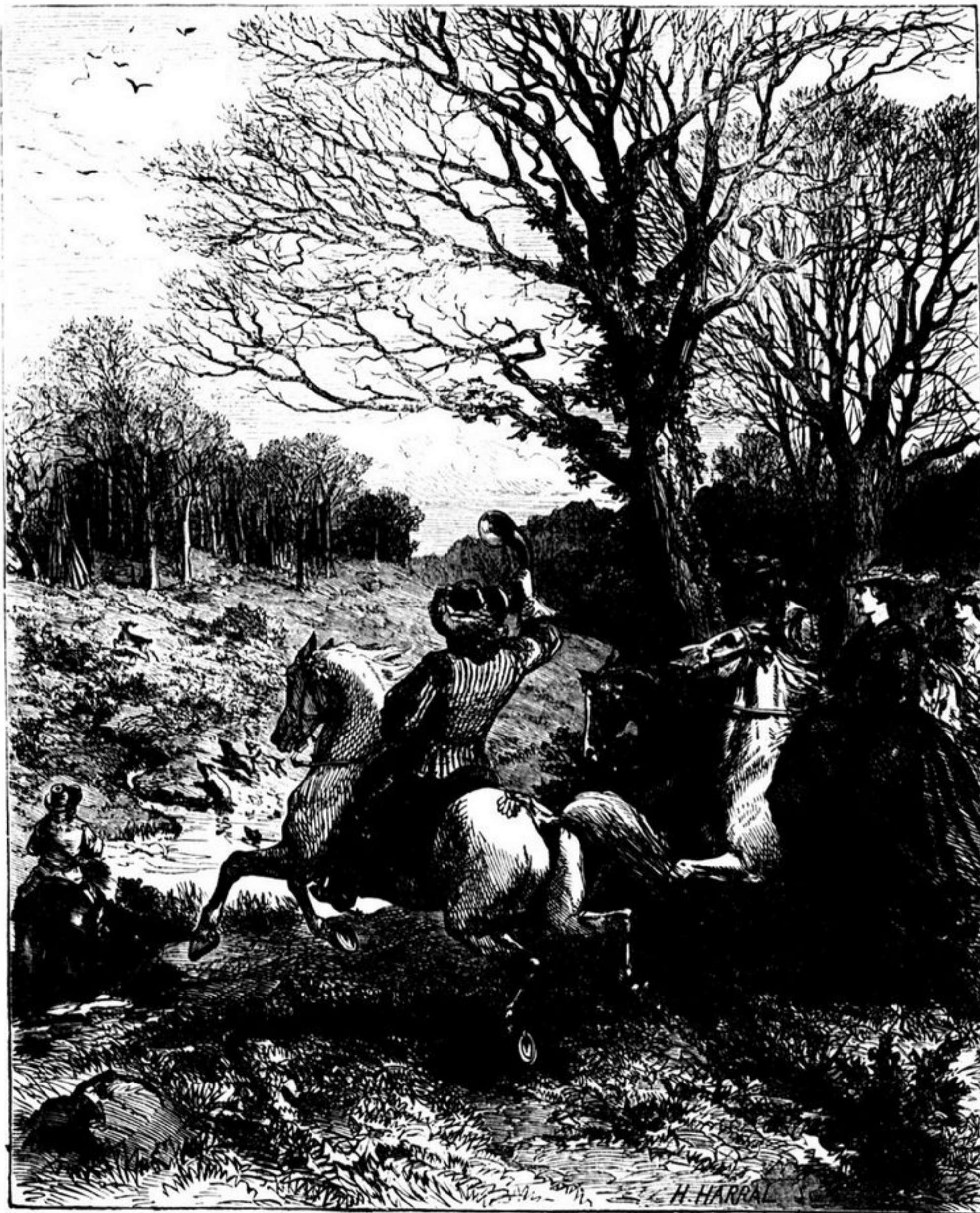
A CAÇADA AOS VEADOS

—E' uma santa e uma martyr! Nunca teve mais do que um amante... que, de mais a mais, lhe batia!