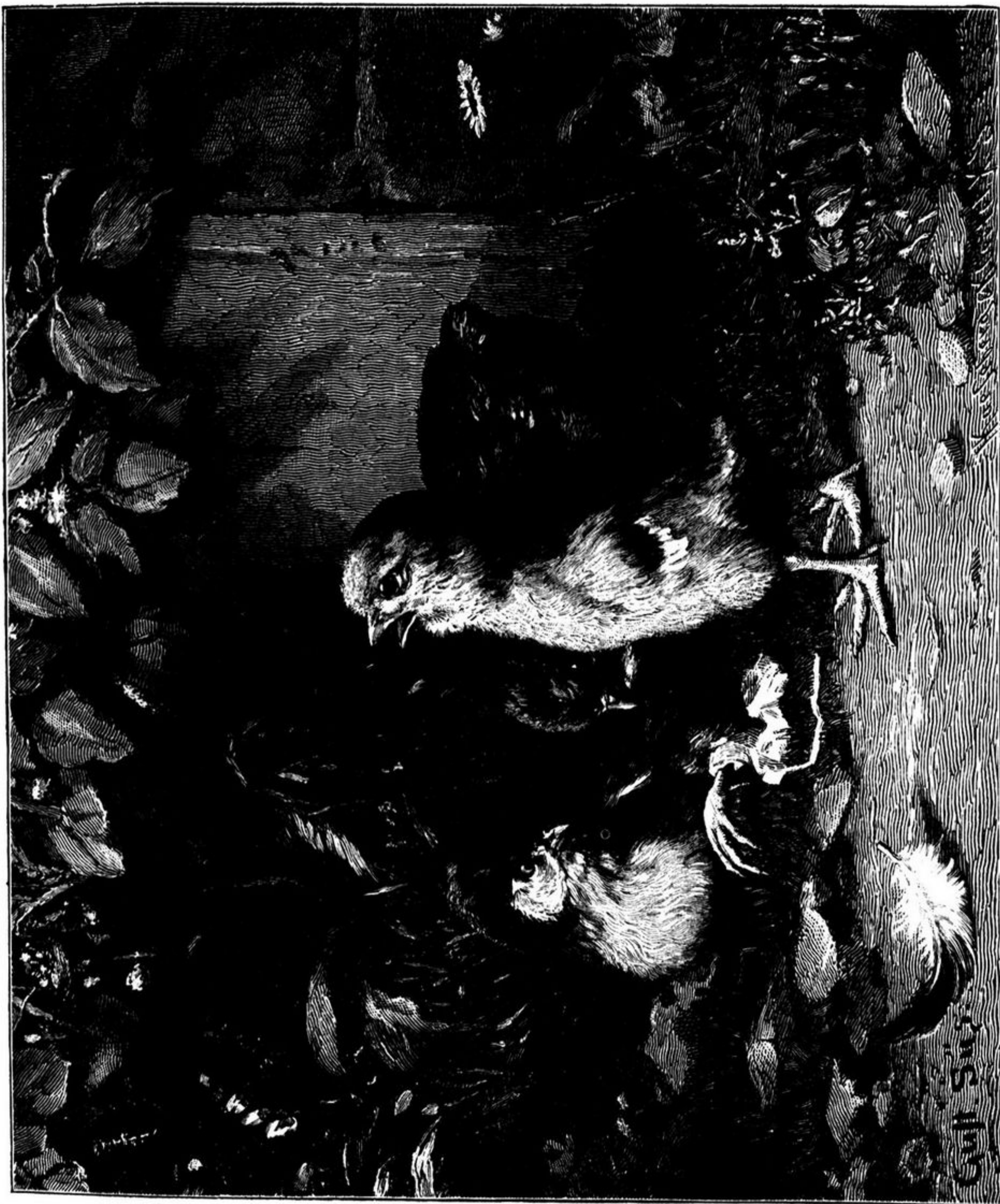
UM TALENTO PRECOCE

caça. Ao pé de toda aquella animação irrequieta das pequeninas aves, faz rude contraste a figura da mãe, toda desconfianças e sustos, crespa de pennas, e olhando com supremo cuidado, ora para a terra, ora para o céu, com receio de que venha alguém appetecer-lhe o delicado thesouro.