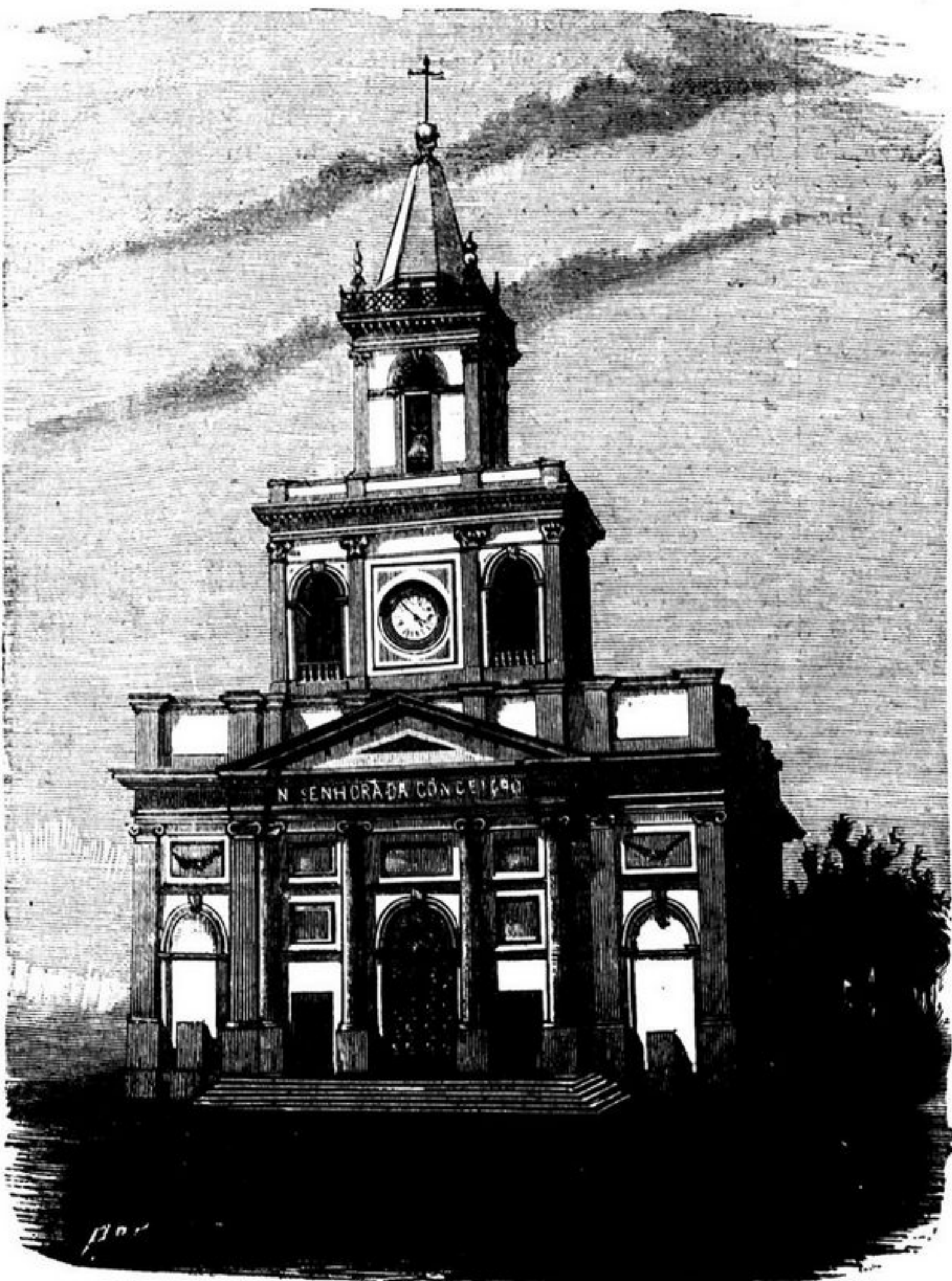
(A NOVA EGREJA MATRIZ DA CIDADE DE CAMPINAS (BRAZIL))

Diziam por ahi uns aleivosos, linguas damnadas, que os alfacinhas, em materia de civilisação, não se avantajavam muito aos hottentotes. Motejava-se á socapa da depravação dos seus gostos. Havia risinhos de chacota para as suas festas aldeãs e primitivas, com areia encarnada a rôdo, pelo chão, e foguetes de tres respostas, á farta, pelo ar. Toda a gente se habituára a considerar o lisboeta como o producto d'um connubio monstruoso entre os naturaes de Chão de Magães e Freixo d'Espada á Cinta. Vendo-o correr desordenadamente para as touradas, acompanhar os cyrios á Outra-Banda, tomar a sério o Justino Soares, voltar a mais supina indiferença aos assumptos d'interesse publico, decilstrar pelas Hortas, devorar, de fio a pavio, os annuncios do Diario de Noticias , e trautear as modinhas banaes das Revistas do Anno ,